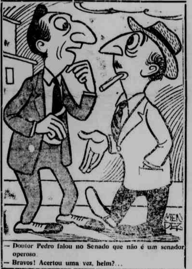
— Doutor Pedro falou no Senado que não é um senador operoso. — Bravos! Acertou uma vez, hein?...

A COFAP será substituída pela INA (Instituto Nacional de Abastecimentos), com funções executivas e fiscalizadoras. As providências anunciadas em discurso presidencial, dão conta das principais medidas que o novo órgão deverá tomar. São elas: construção de silos e armazéns; mercados abastecedores nas grandes cidades; facilidades de transportes ferroviários e (Concluída na última página)