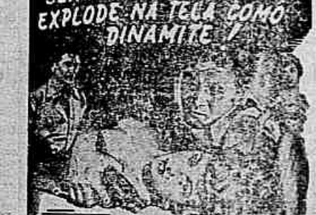
JOHN GARFIELD SHELLEY WINTERS

Este filme não será exibido no Cine Vera Cruz por falta de vagas.