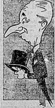
Ministro Vicente Rão