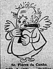
St. Flávia da Cunha. RIO, 8 (SE) - Publica o...

trabalhadores, que protestam contra as restrições no transporte para Berlim, para receberem os pacotes de viveres "Eisenhower".