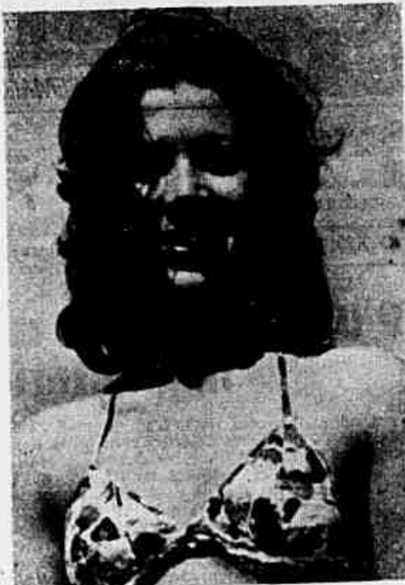
Na foto uma das belas Miss que estarão apresentando o importante acontecimento social de hoje.

As 23 horas haverá o grande baile no salão de festas do Varginha Tênis Clube, animado pelo Grupo Som Especial.