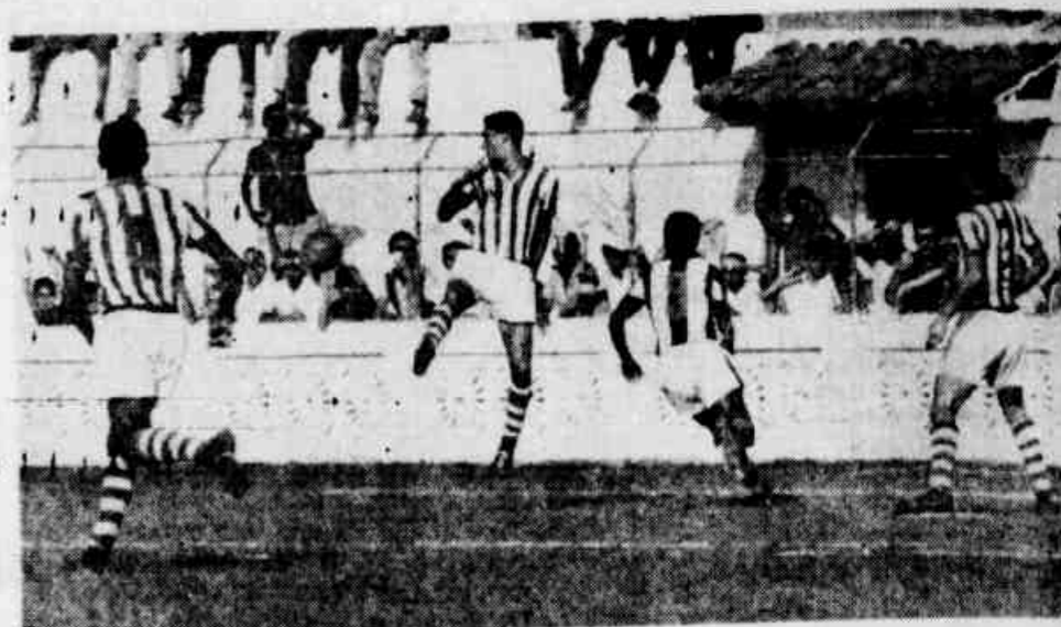
Lance da última partida entre Central e Centro, quando centralinos e centristas empatarem por 2x2. Amanhã, haverá a "bêrra", em jogo que será travado em Limoeiro

No dia de ontem, os dirigentes do Esporte pagaram a importância de Cr$ 20 mil a cada jogador, pela vitória conquistada ante o Náutico. Conseguimos apurar que se o time da Ilha do Retiro levar os seus finais, a gratificação será de Cr$ 40 mil e se alcançarem o tri-campeonato, o "bichito" variará entre Cr$ 60 mil a Cr$ 70 mil, desde que os sócios se colizem para aumentar a gratificação dos atletas rubro-negros.