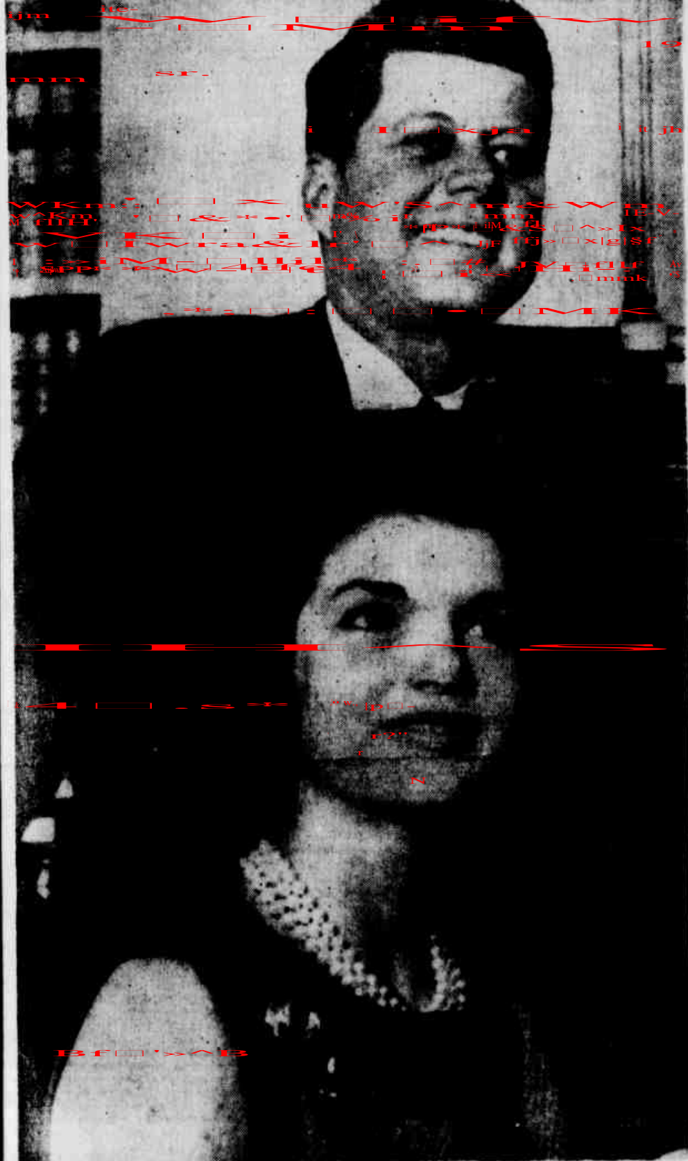
O mundo já se acostumara com o sorriso de Kennedy. O sorriso jovial, que enfrentava com firmeza e energia os grandes problemas do mundo atual. Que se viu após o bloqueio de Cuba, na assinatura do Tratado de Desnuclearização com Moscou, no fim da batalha racista das ruas de Alabama. E que deu ao mundo, em três anos, dez meses e um dia de Governo uma tranquilidade, senão total, mas suficiente para quebrar o degelo e o terror atômico. Sorriu desfeito pela brutalidade de um disparo que roubou ao mundo o estadista da paz.