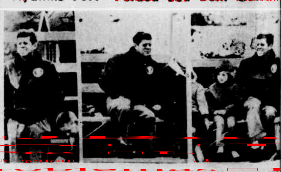
Em Hyannis Port, Massachusetts, há um ano atrás (28-11-62), Kennedy se ocupou de seu próprio degelo: de blusão esportivo, cabelo despendendo, o mandatário dos Estados Unidos passou o dia brincando com seus filhos ou assistindo (foto) seus filhos disputarem partidas de golfe. A mãe dos Kennedy era feliz.