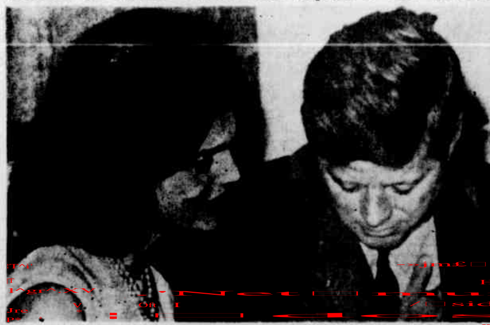
O drama vence a perplexidade que se apodera do mundo, e todos perguntam: "Como Jack?" Ninguém imaginava que a felicidade do casal fosse desfeita assim: Jacqueline surpreendida com o marido baleado, engrandando nos seus pés. Desde o Papa até a mais simples camponesa da Austrália, o mundo acompanha a dor de Jack. E chora também.