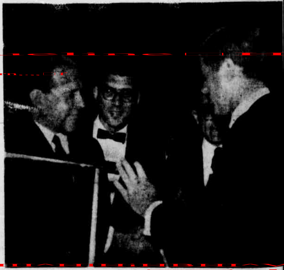
Kennedy e Jango se entrevistaram duas vezes: a primeira, quando o presidente brasileiro foi conagrado nas ruas de Nova Iorque e discutiu com JK os grandes problemas da América Latina; a segunda, em Roma, após a coroação do Papa Paulo VI. Duas vezes, os dois presidentes conseguiram um diálogo cordial e francamente benéfico para os dois países. Ambos eram moços e amigos.