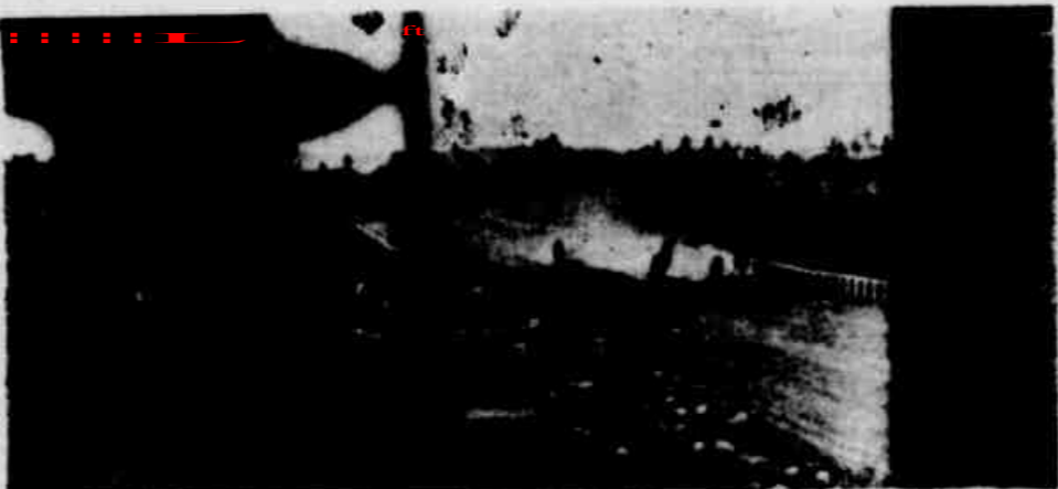
O uso de estimulantes nas corridas de cavalos, surge com mais intensidade nas disputas dos Grandes Prêmios

Uma das metas (principais) da atual direção do Jockey Club de Pernambuco é moralizar o Hipódromo da Madalena, expulsando o uso do "doping" e coibindo, a qualquer preço, a prática criminosa. Na verdade, um páreo onde se concorre animais "dopados" deixa de ser uma disputa atraente e singular para dar lugar a um amontoado de loucos em busca da lúbia fatal, trazendo, para a sanha dos seus donos, uma mesquinharria. A atitude dos dirigentes do Jockey Club de Pernambuco merece o aplauso daqueles que lutam irmanados para acabar, de uma vez por todas, com a repudiada prática criminosa e inconsciente.