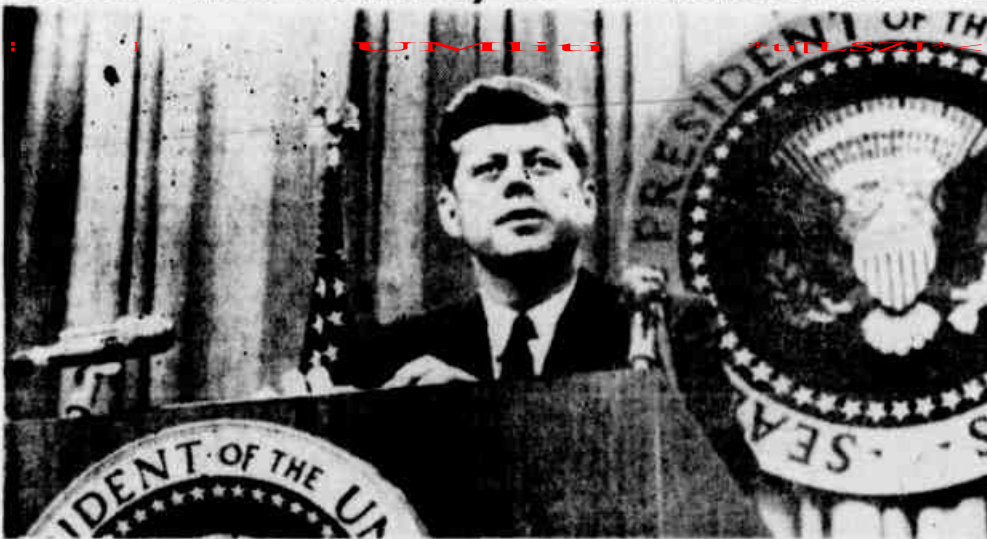
Toda seu governo foi dedicado ao degelo das relações internacionais. Depois de convocar os Estados para "se preparar para o pior", no caso do bloqueio de Cuba, Kennedy parou para negociar a paz com Moscou, conseguindo, há poucas semanas, o tratado que toda humanidade aplaudiu. Uma bela de um jantão tirou-o da luta pela paz.