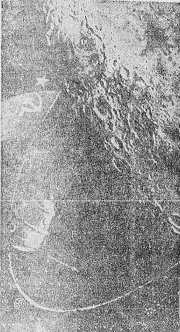
Pela primeira vez na história, um aparelho cósmico conseguiu voar em órbita lunar. É o Luná-10, cujo desenho artístico publicado pelo Izvestia, ao voar em volta do satélite da Terra, é visto acima.