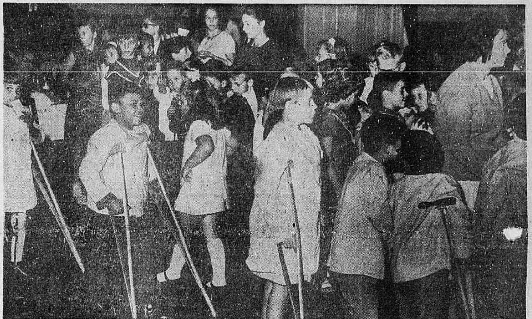
O Clube Concórdia encheu-se ontem de sorrisos infantis das crianças da Associação Paranaense de Reabilitação que, juntamente com os filhos dos sócios daquela sociedade receberam ovos de chocolate, coelhinhos e muitas guloseimas mais. É uma inovação na festa de Páscoa no tradicional clube, que suspendeu seus bailes para realizar uma festa, em que as crianças foram as homenageadas embora um dia depois.