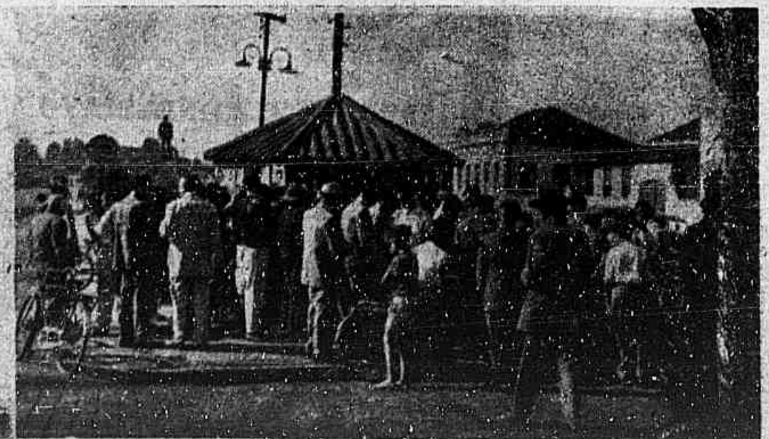
Instalando auto falantes em cidades de nosso interior, a Rádio Marumby colocou também em Paranaguá, seus auto falantes, que foram instalados na banca do distribuidor do "Paraná Esportivo", naquela cidade do litoral. O público acorreu as ruas e escutou o jogo final da Copa do Mundo através da "emissora dos esportes do Paraná".