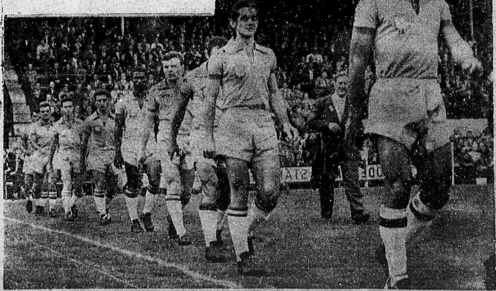
BRASILEIROS no Estádio de "Råsunda", em Estocolmo. Seis vezes em trram assim, em "fila indiana", para a glorificação em magníficos e inolvidáveis feitos. "Raça", coragem, bravura e sentido de luta no plantel como o Brasil jamais conseguiu reunir igual