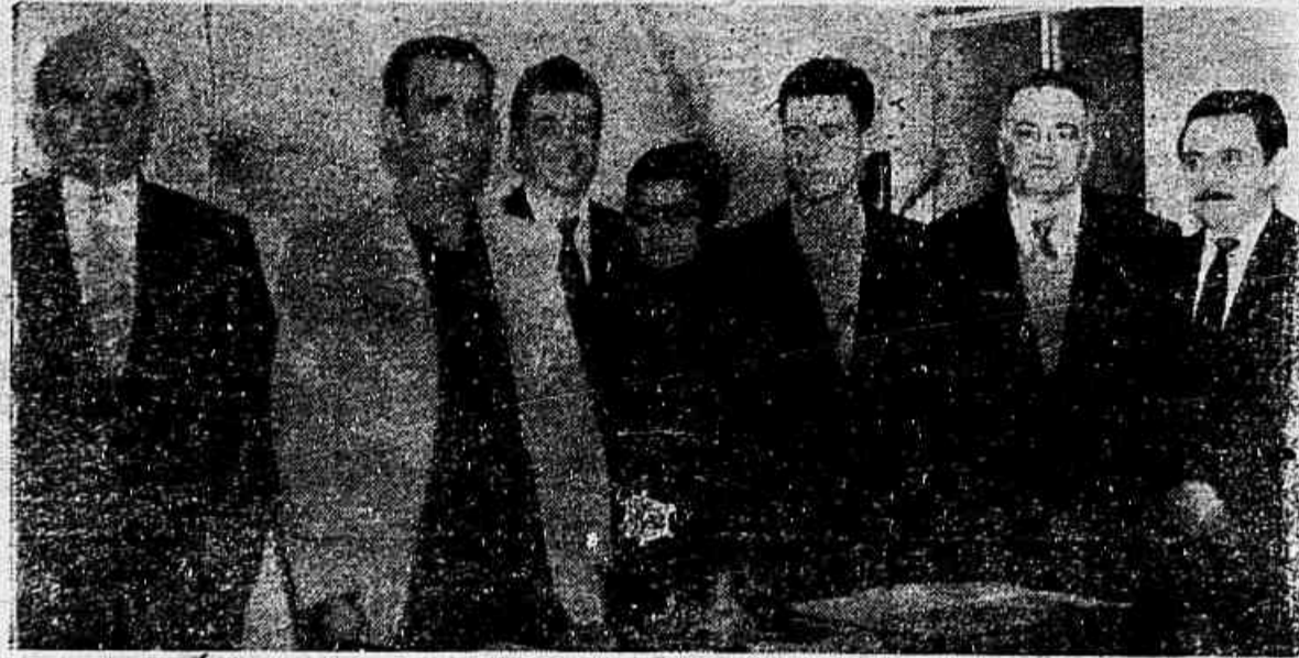
A foto é da entrega, na noite de visões "Clubes Unidos", concurso dos vários clubes de nossa cidade, dos prêmios aos acertadores. Os felizes acertadores receberam capital dentro do Grande Concurso de Previsões.

O clube rubro-negro "esqueceu" de informar a F.P.F. sobre seu interesse em renovar com o estupe do zagueiro lateral Prêmios No Concurso De Previsões "Clubes Unidos"