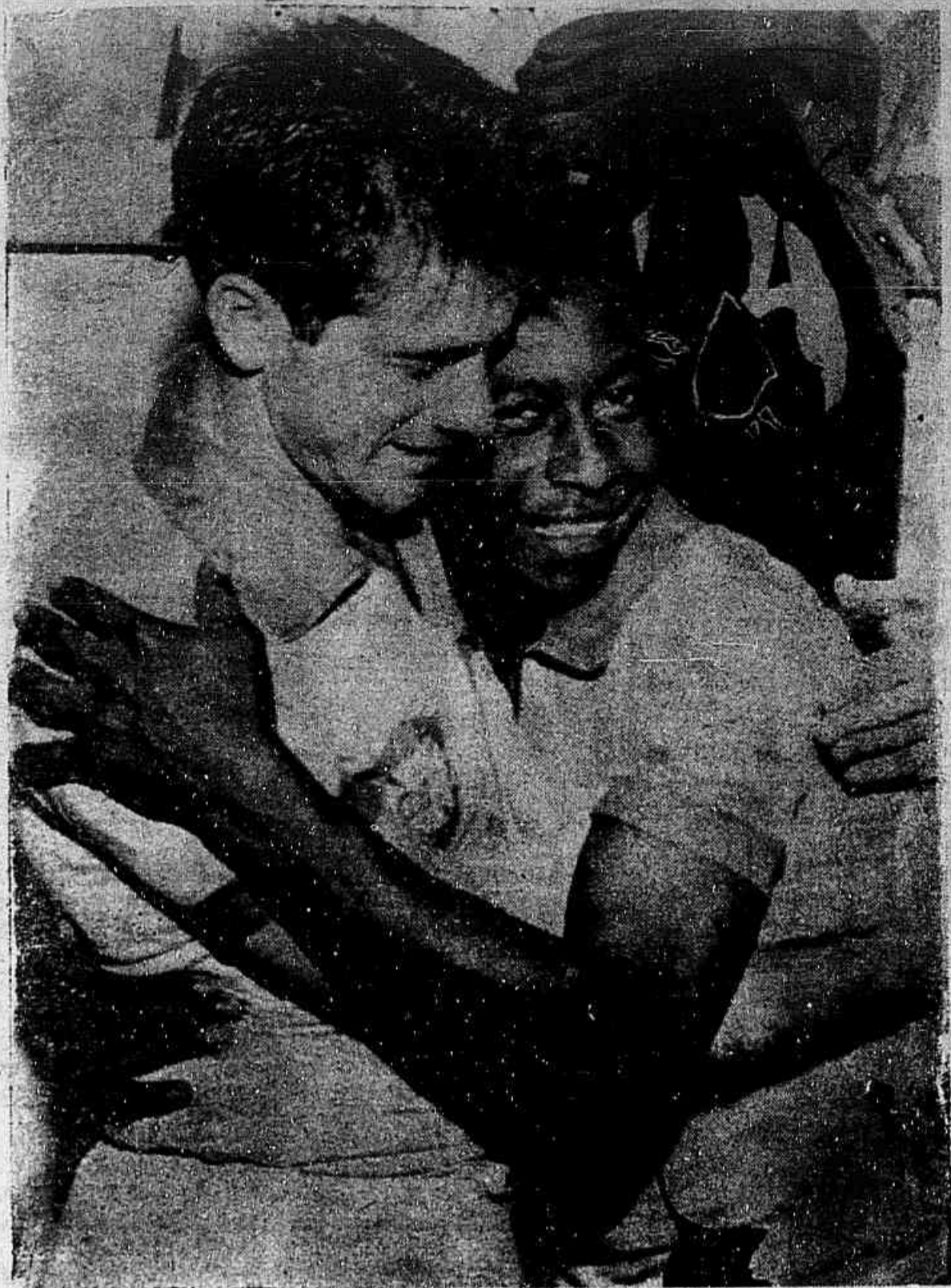
BELINE, "o grande capitão" num abraço apertado com Pelé, o menino prodígio da VI COPA DO MUNDO. Um e outro foram maravilhosos na defesa da força e das pretensões do futebol nacional agora justo e magnífico Campeão do Mundo. Foi o abraço da vitória. E isso dispensa o que mais se possa dizer

Confirmados os entendimentos, ontem à noite, pelo Presidente Benedito Del Bosco — Esforços, agora, visando as presenças de Vicente Feola, Dino, Mauro e De Sordi