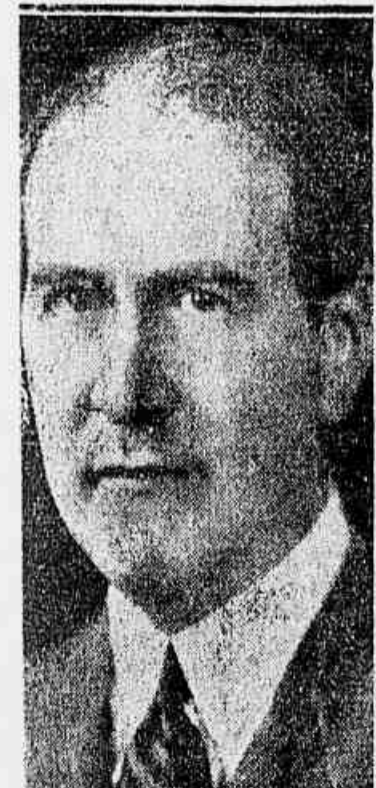
Sr. OSWALDO ARANHA