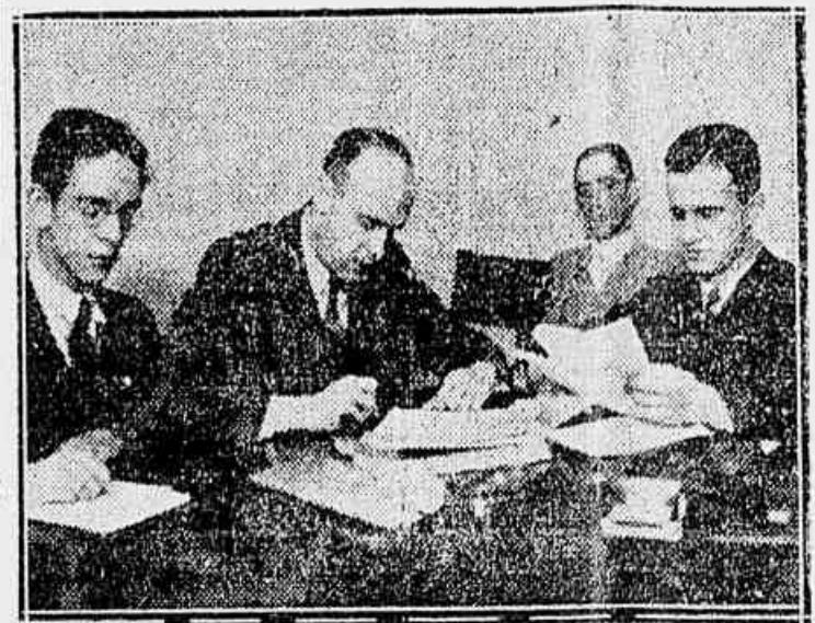
EM PLENA ACTIVIDADE

O CORREIO DE S. PAULO, no intuito de trazer os seus leitores a par do que se passa nas rodas politicas, foi, hontem, visitar a Liga Confederacionista, à rua CENTRO INTELLECTUAL E COLUMNA DE CHOQUE A Liga Confederacionista está constituída em dois grupos: o centro intellectual e doutrinário