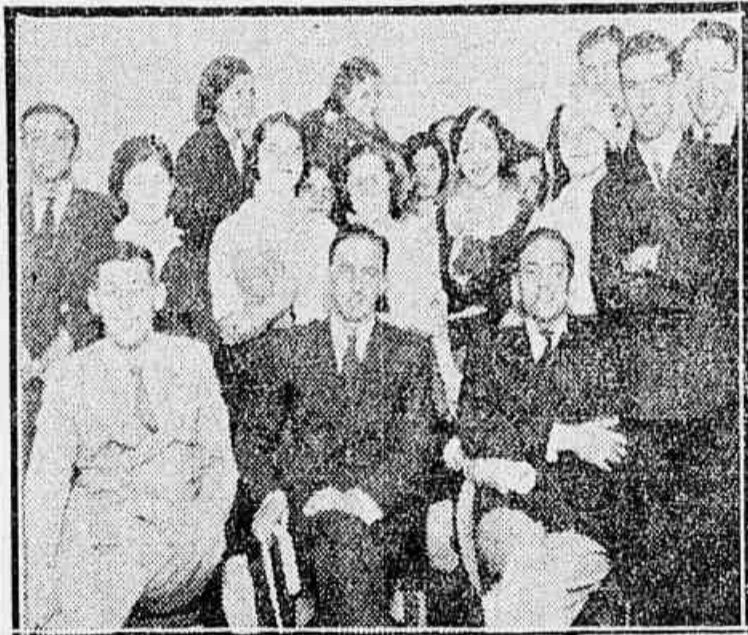
Alumnos e alumnas do Instituto Caetano de Campos em visita ao "Correio de S. Paulo"