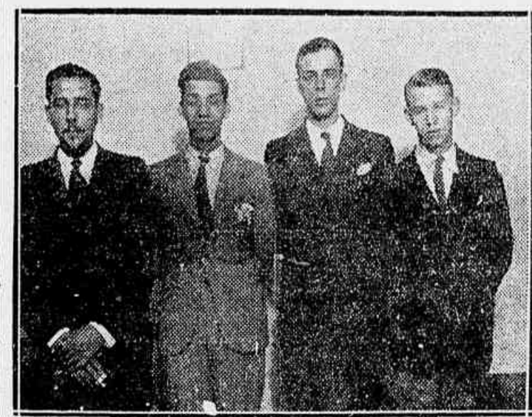
Um grupo de gymnasianos em nossa redacção

S. exa. attendeu aos estudantes paulistas nas suas pretensões. Por isso, a estudantada, esteve hontem na redacção do CORREIO DE S. PAULO para que fossem os inter-