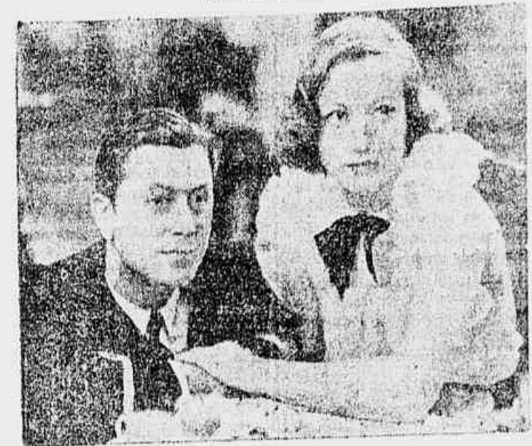
Joan Crawford e Robert Young numa cena da super-produção da Metro "Vivamos hoje", que o Cine Paramount nos apresentará segunda-feira proxima

JOAN CRAWFORD E ROBERT YOUNG NA SENSACIONAL PELLICULA DA METRO GOLDWYN MAYER "VIVAMOS HOJE"