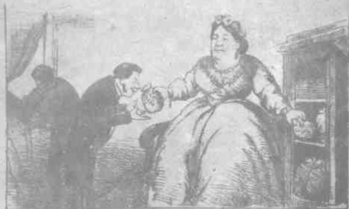
Estima (1862) gravura de CHIOCCI, RIOBRUNO