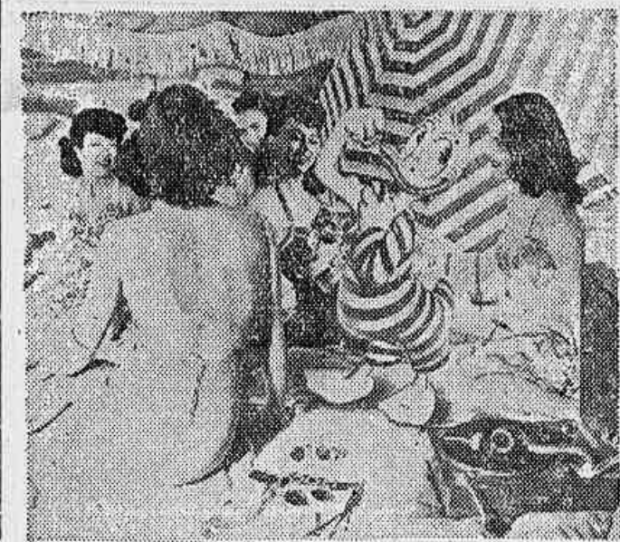
O Pato Donald exibindo sua musculatura a um grupo de internatistas garotas de Hollywood... Cena de "Vocês já foi à Bahia?" que a RKO Rádio está exibindo novamente no Plaza, Parisiense, Astoria, Olimpia, Ritz, Star, Colonial, Primor e Mascote