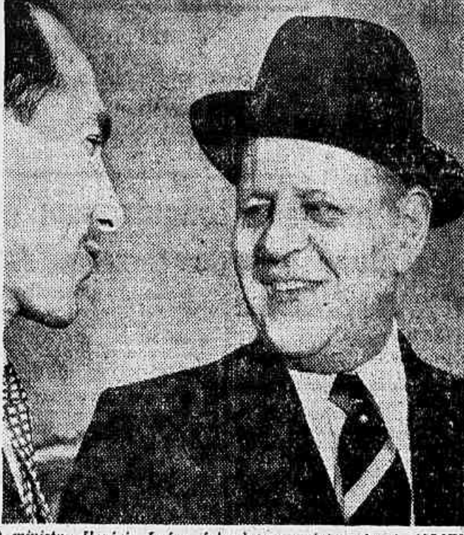
O ministro Horácio Lafer, falando ao repórter de A NOITE