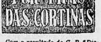
Com o resultado do G. P. "Diana", ficou sendo a seguinte a classificação na estatística clássica do corrente ano: