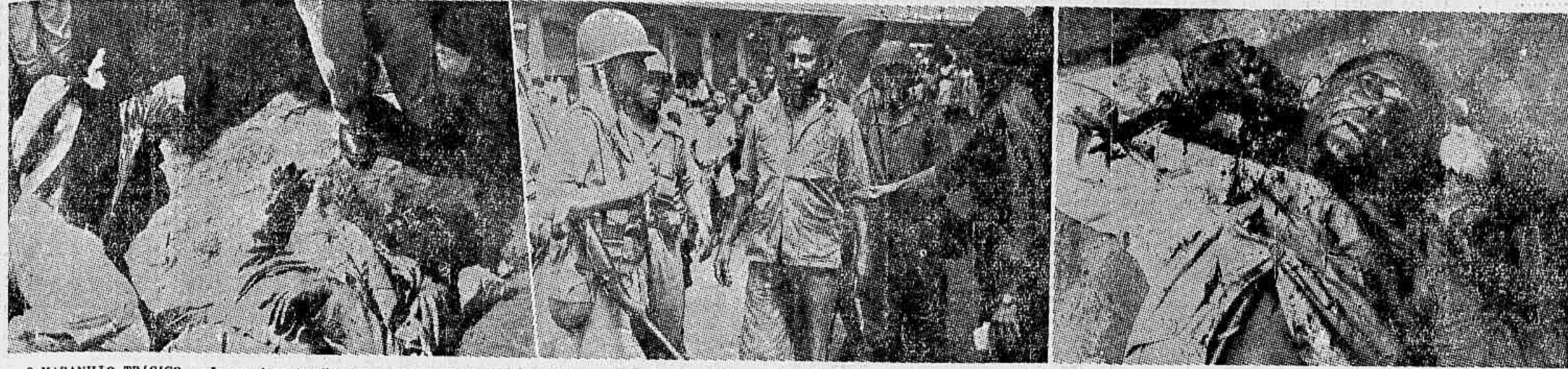
O MARANHÃO TRAGICO — Impressionantes flagrantes da desvaiv da paixão política que envolve os espíritos em S. Luiz do Maranhão. O homem que se vê ao centro, sangrando e protegido por soldados da força federal, escapou, embora gravemente ferido, de ter o destino dos seus dois companheiros cujos cadáveres se vêm rolando no chão. Funduzia ele uma mala com armas quando foi atacado por populares exaltados. Na primeira foto uma das vítimas da ira popular já expirava enquanto a outra se contorce em dores.

Quarenta intelectuais da capital mineira manifestam-se contrários à realização do Congresso de Escritores, em Porto Alegre — Simples instrumento de agitação política do Partido Comunista