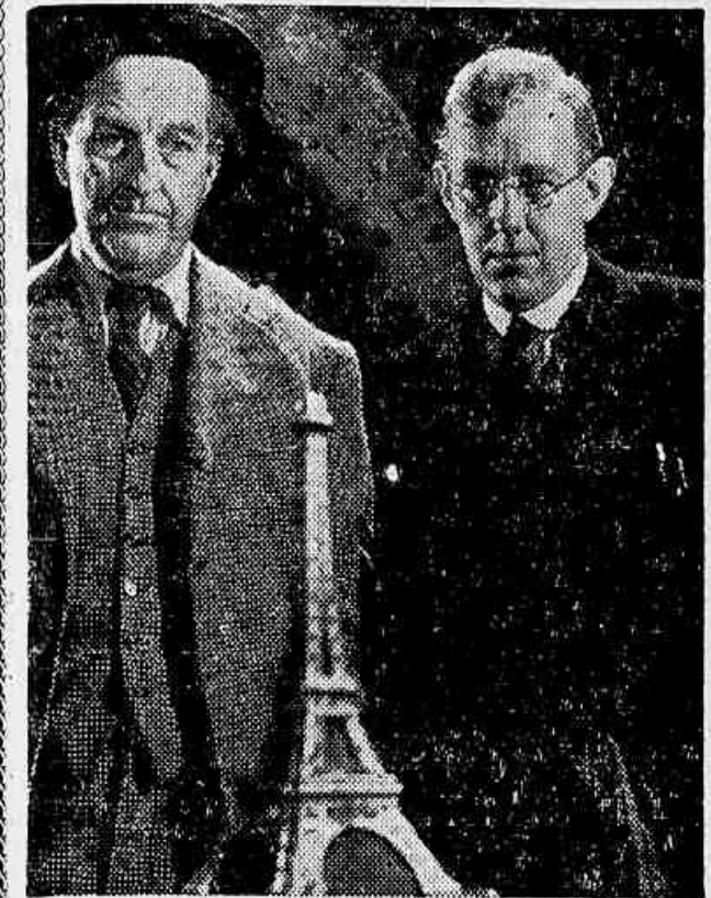
O "souvenir" da Torre Eiffel ou "pivot" do filme. Cena de ótima comédia, com Alec Guinness e Stanley Holloway

(PRESENCIADO EM CAMBRIDGE, NO CONGRESSO DO FILM CLUB) HUMOR BRITANICO — Cuida para tem as suas próprias características, a fim de participar do senso de humor. A não ser através das coisas simples da vida, há dificuldade em ser transmitido um padrão internacional para a arte de fazer rir. Por vezes, mesmo preso a características regionais, é ainda possível ser desfrutado o espírito humorístico de um povo. O presente trabalho conseguiu este difícil objetivo através de recursos satíricos. Neste campo, o sentido comático ironizar sem se fazer notar. Pequenas ou grandes irreverências que surgem no decorrer da agitação dos acontecimentos, sem jamais lembrar qualquer preparação. A grande habilidade desta película está na sutileza com que o recurso foi utilizado. Esta verdadeira insinuação transparece tanto a entidades da própria Inglaterra — ironia às autoridades do Scotland Yard, ao funcionalismo bancário, etc. — quanto ao estrangeiro. Assim, sempre na mesma e aguda discreção, sem procurar ferir nem chocar a França, por intermédio das suas exigências alfandegárias, também paga o seu tributo Fora disto, o espetáculo é eminentemente divertido.