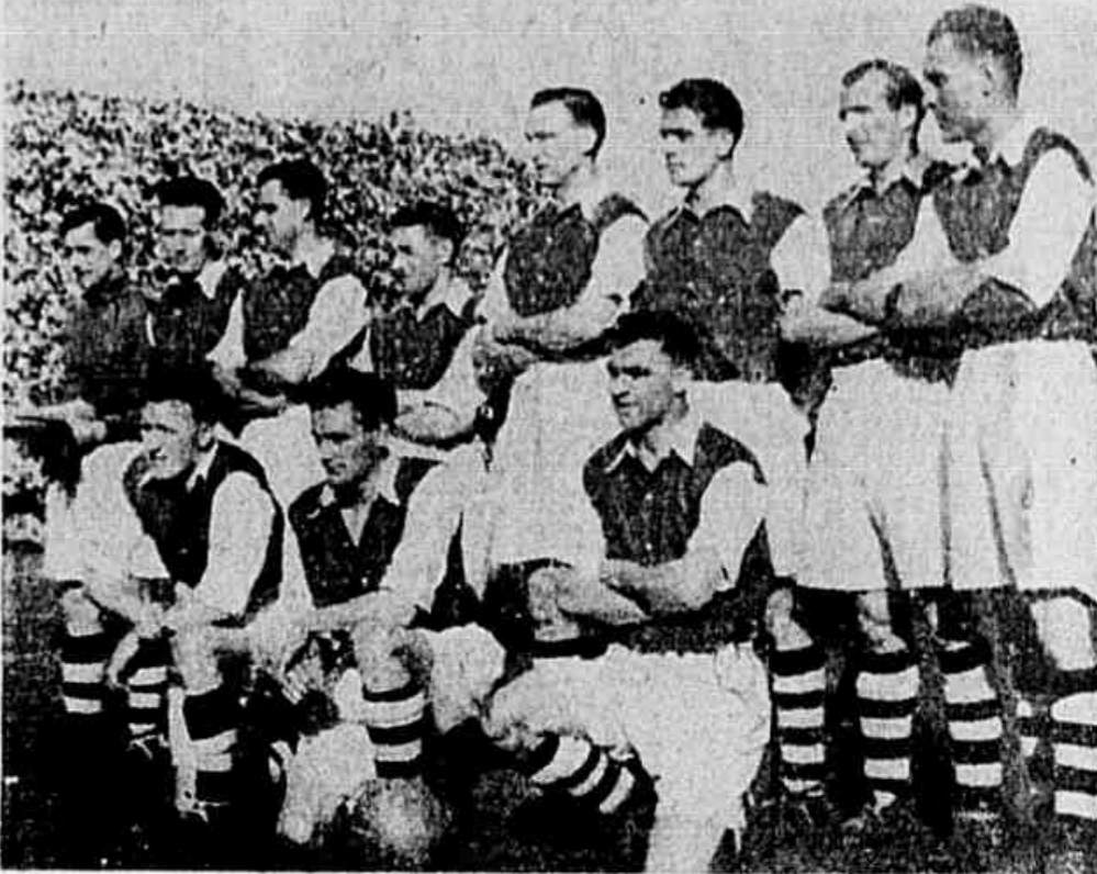
O esquadrão do Arsenal que, amanhã, estrará em São Paulo, enfrentando o Palmeiras