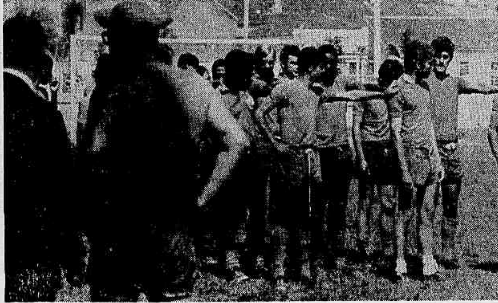
Lusos continuam dando duro lá no Canindé