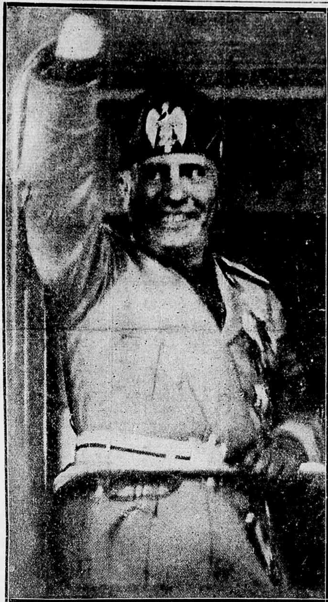
Mussolini no trem, ao deixar Berlin, na visita feita para consolidar o eixo nazi-fascista