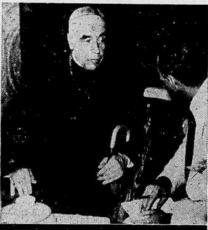
O arcebispo Horacio Campillo em palestra com o DIARIO DA NOITE, a bordo do "Conte Grande"

Em 29 de dezembro de 1937 o antigo Conselho Federal do Serviço Publico, submetteu à apreciação do presidente da Republica, que o aprovou, um