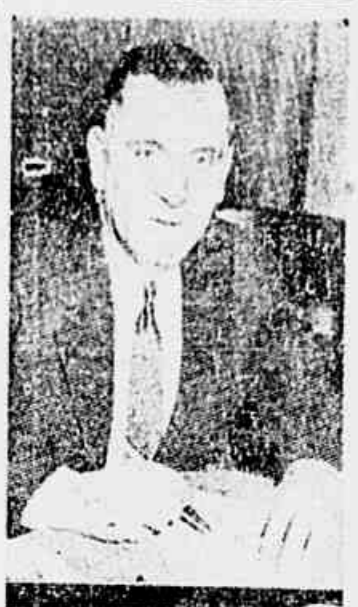
O sr. Fritz Kuhn