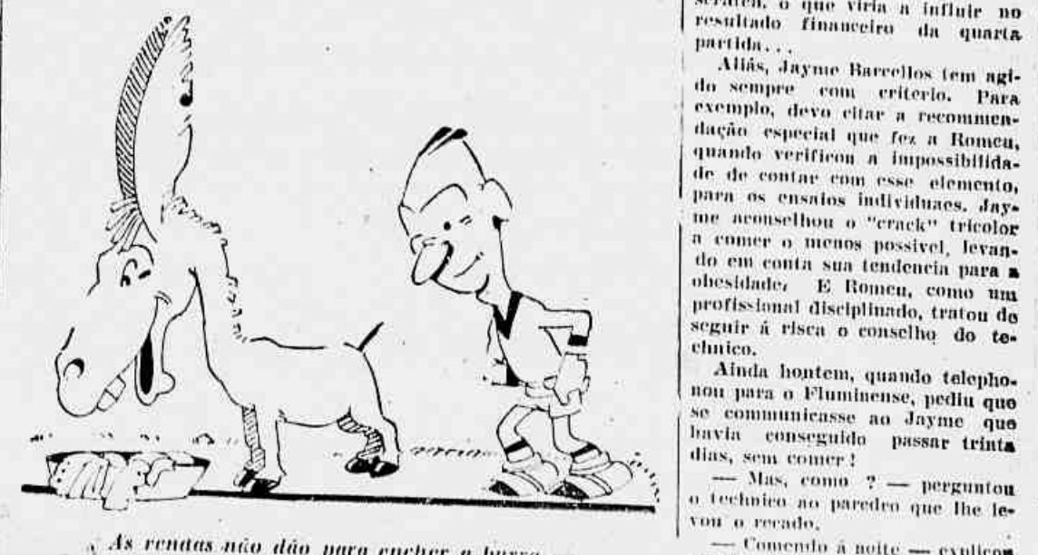
As revistas não dão para encher a burra...