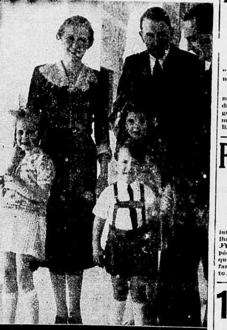
A familia Goebbels e o chanceler Hitler, numa photographia tirada logo após o ruído "caso Lida Barova".