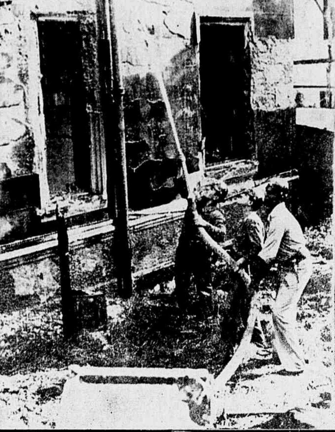
Os bombeiros lutando contra as chamas, no edificio do laboratorio Moura Brasil