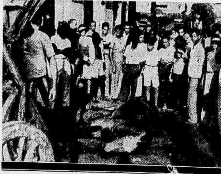
O local do desastre, vendo-se um dos animaes, que morreu em consequencia do choque