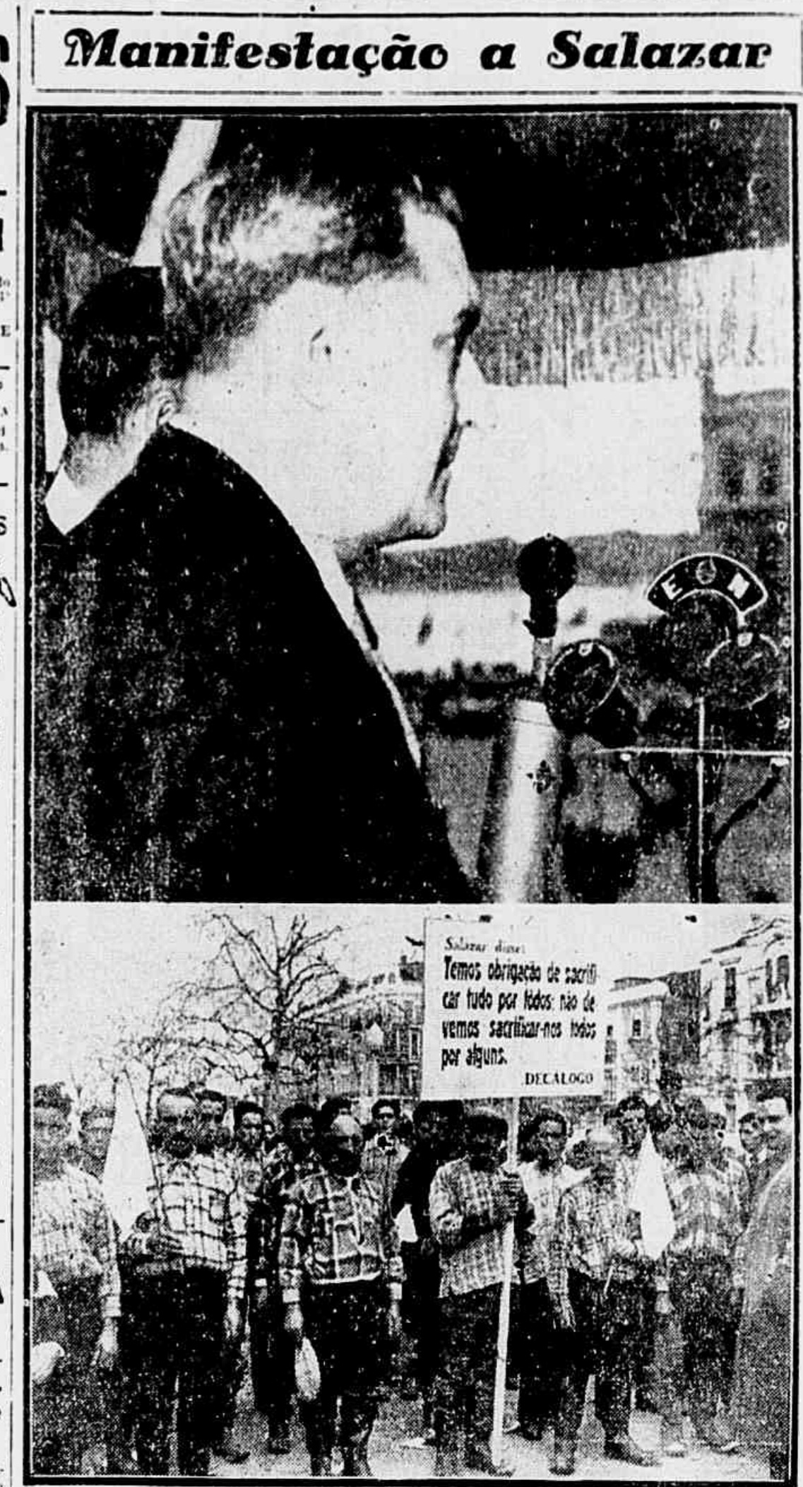
As classes operarias de Portugal realizaram, no inicio desta semana, uma grandiosa homenagem ao sr. Oliveira Salazar. Na gravura, em cima, vemos o chefe do governo portu- guez pronunciando seu discurso aos operarios, e, em baixo, um detahe do cortejo