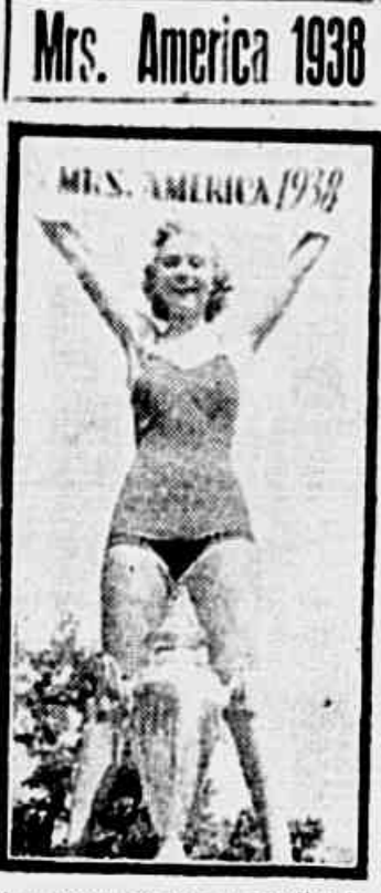
Mrs. America 1938

Descobertos pelas autoridades e presos os conspiradores