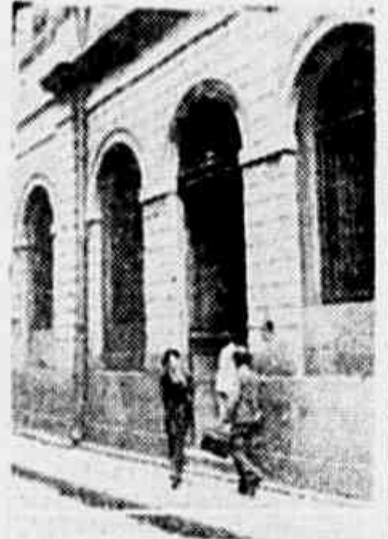
A porta do Tesouro Nacional por onde os papéis entraram em 1903, para sair em 1931

O DIÁRIO DA NOITE, que teve conhecimento de que hoje os papéis chegaram ao Ministerio da Educação, enviados pelo ministro Osvaldo Aranha, publica