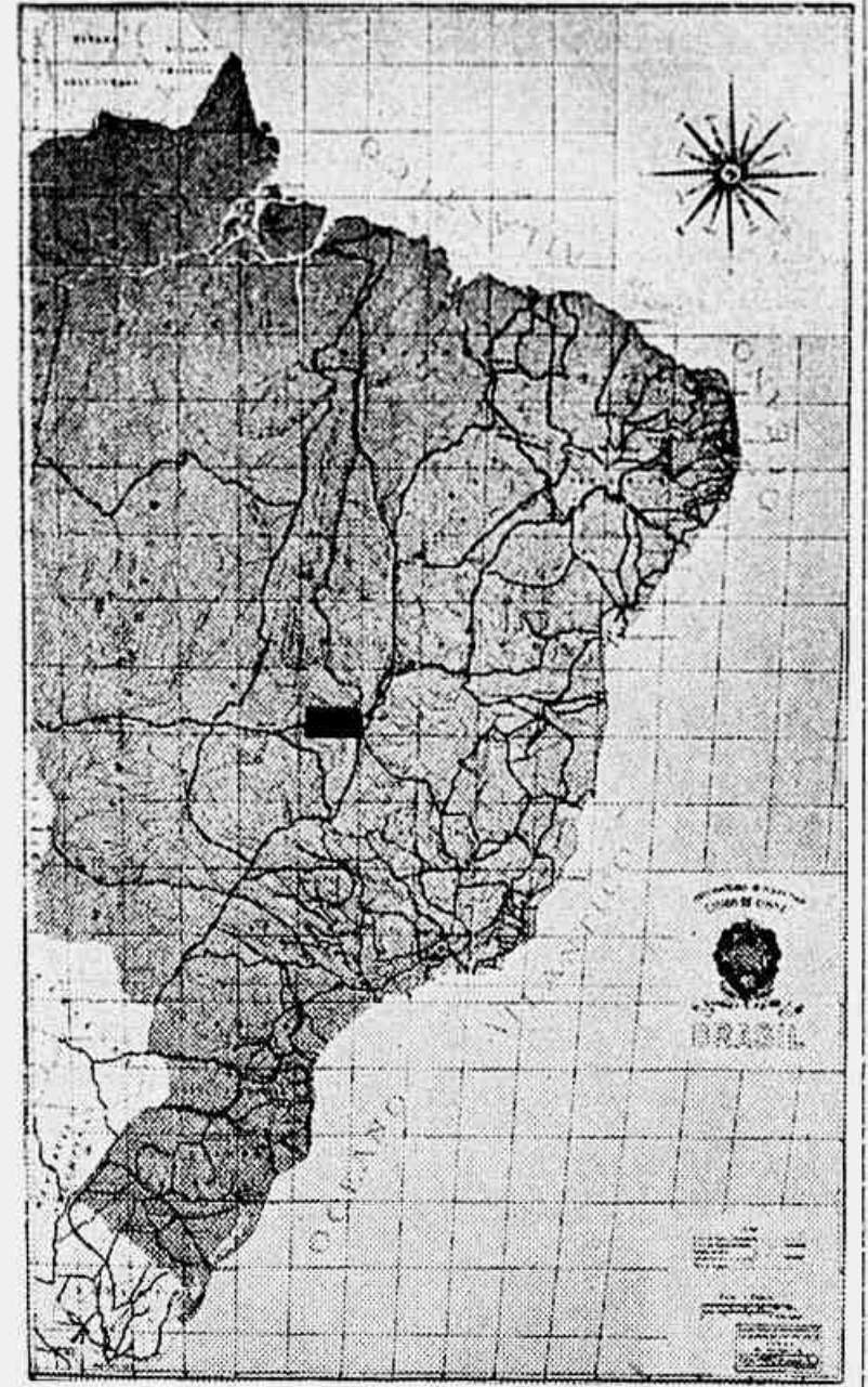
O mapa onde se vê o anedotico municipio

A bem dizer, no Rio, como de resto, em todos os Estados, quem se encarrega deste serviço de prevenção é a imprensa, pela atividade tenaz e investigativa das suas reportagens. Não raro, os jornais vêm reclamando as vistas policiais para casos que estão, at. à luz meridiana, desafiando o bom senso e a energia das autoridades. O caso de "Planopolis", "Planolandia" ou coisa que o valha é tipico. O DIARIO DA NOITE, em sua edição de 6 de fevereiro do ano corrente em reportagem detalhada e sensacional, apontou a "chantage" de alguns indivíduos que alterando o nosso mapa geográfico, enervavam nos sertões goianos, um mu-