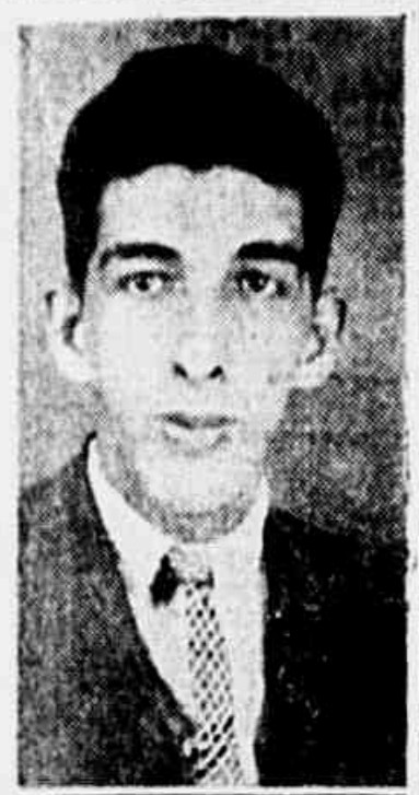
Machado, um dos maiores torcedores do S. Cristovão

O Sr. Cristovão, como todo o torcedor que se preza, possui, tam- bem, um numeroso grupo de fervorosos torcedoras.