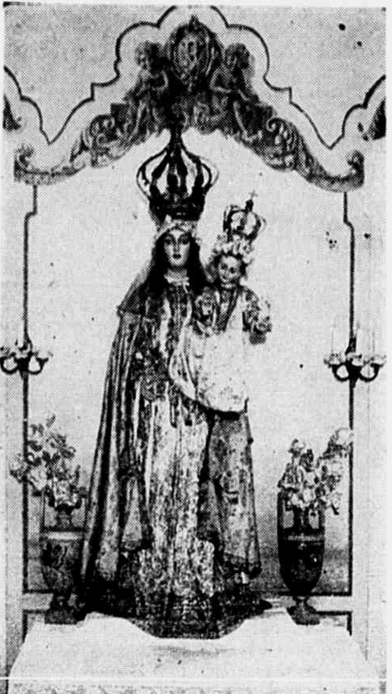
A imagem de N. S. do Rosario, de tamanho natural, que vai ser exposta no proximo domingo.

Paginas fulgurantes da historia do Brasil escritas no Consistorio da Irmandade