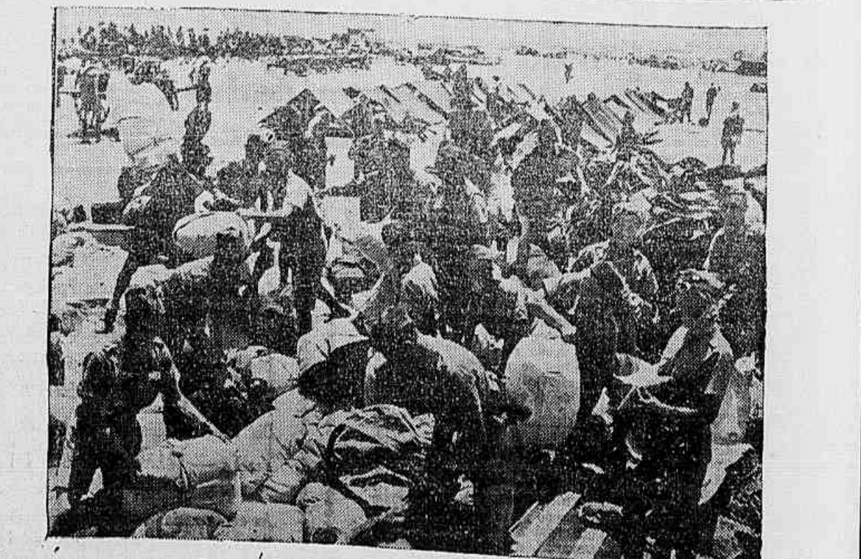
Um acampamento do exercito polonez no deserto da Africa do Norte. Des-canso depois da marcha nas areias ardentes do deserto

SOLDA ELECTRICA Telefone para quem tem conhecimento em Técnico em sua Casa Fone - 55 - Rua Marechal Floriano Pelozo, 1059