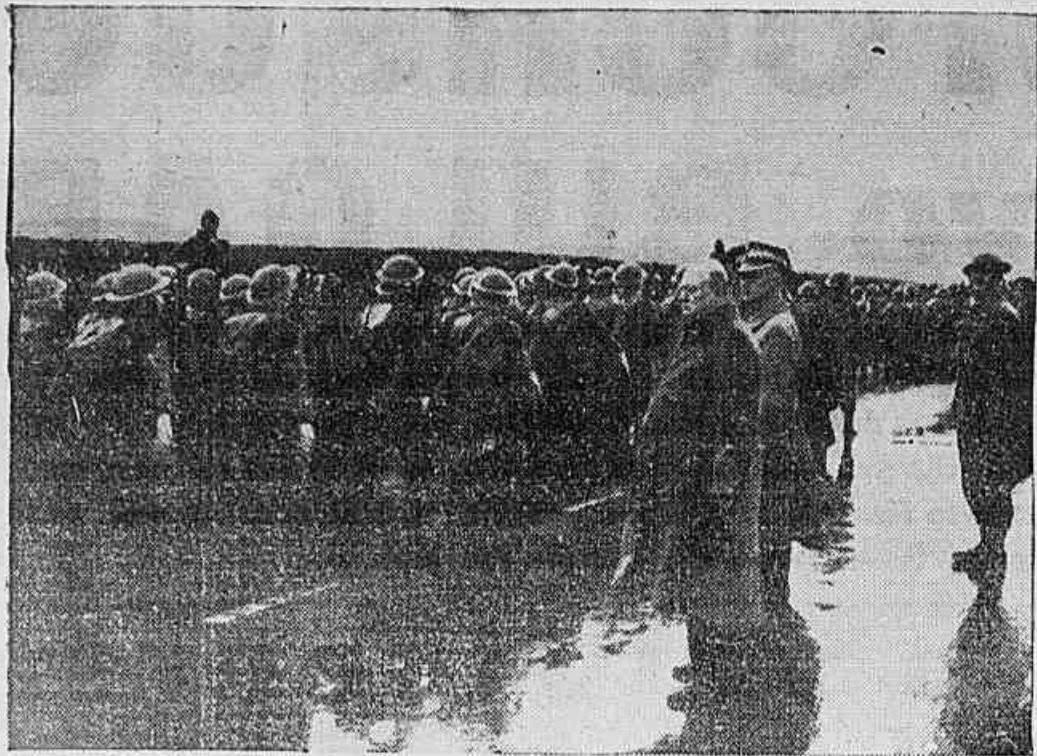
O Primeiro Ministro, Sr. Churchill, e o General Sikorski, Chefe do Exército polonez, num logar na Inglaterra, assistindo um desfile durante a inspecção do treinarmento militar.