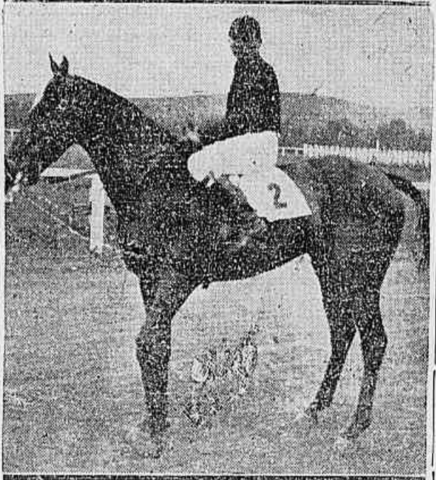
Um dos serviços competidores da prova máxima. RECURSO

O "betting" de duplas, acumulado em 50 contos de reis, figura como atração máxima - Progностicos. - Outros comentários