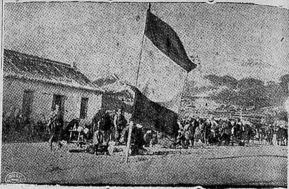
A bandeira monarchista desfraldada na fronteira franco-hespanhola

Todos os edificios destruidos pela artilharia nacionalista serao novamente levantados — Trabalham no saneamento da cidade todos os populares disponiveis