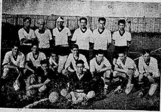
A EQUIPE AC TUAL DO CARAMURU'