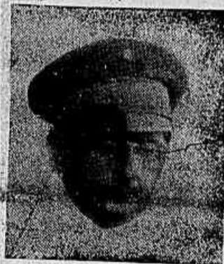
GAL. EURICO DUTRA