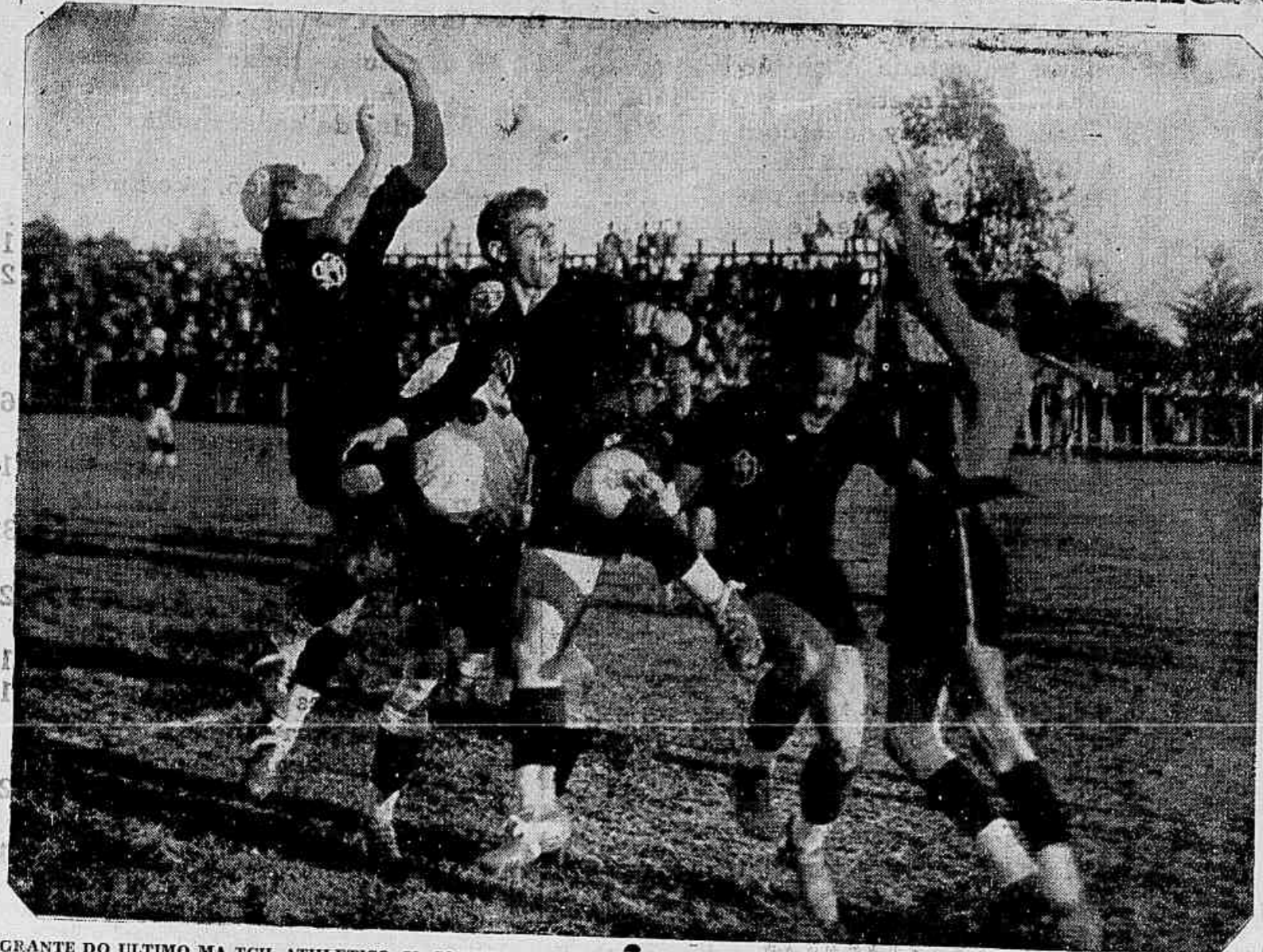
FLAGRANTE DO ULTIMO MATCH ATHLETICO X CORITIBA. — TEREMOS NOVO ENCONTRO DOS DOIS VELHOS RIVALES NO 1º TURNO?

A sorte do Athletico, do Britannia e do Ferroviario