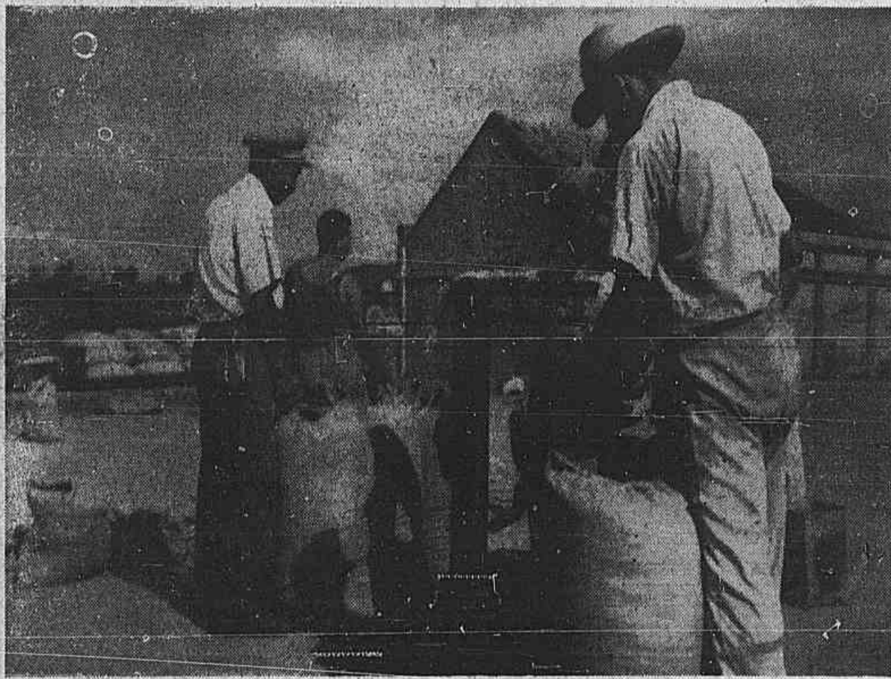
O brasileiro planta e colhe o trigo. Mas o produto acaba nas mãos dos donos dos grandes moinhos. O farelo de trigo controlado pelos trustes estrangeiros, entre 1957 e 1958, sofreu um aumento de 169%.

Empregados brasileiros substituídos por estrangeiros — Entram no país, como simples "turistas" e obtêm depois a regulamentação de sua situação mediante manobra no Ministério do Trabalho — Demitidos cêrca de 30 empregados, somente num dia, alguns prestes a atingirem a estabilidade — A desapropriação do Edifício Shell e a paralisação da Avenida Perimetral (Leia na 5.ª página)