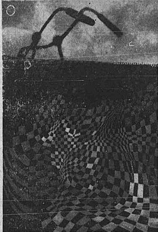
As bicicletas julgam tanto quanto as quadriculas que servem de base a inúmeros trabalhos seus