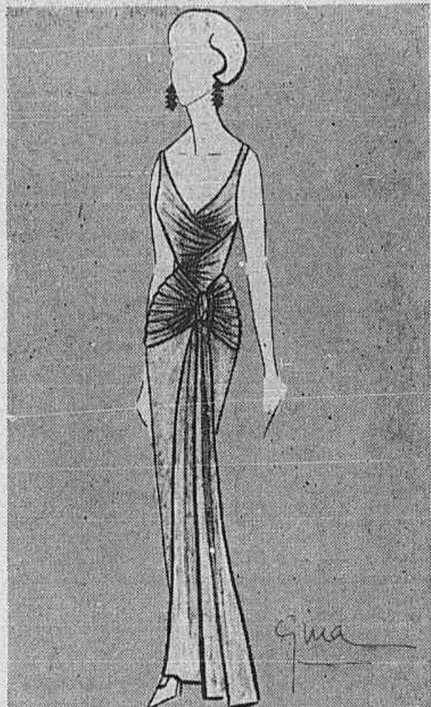
Vestido para baile em gaze azul-turquesa. Frente: drapeados enviezados até a altura dos quadris. Costas: amplo decote em V, terminando na cintura. Saia reta. Complementos brancos.