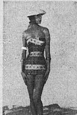
Bonito maiô em algodão estampado em cores vivas. Lenço vermelho e chapéu de palha branca.