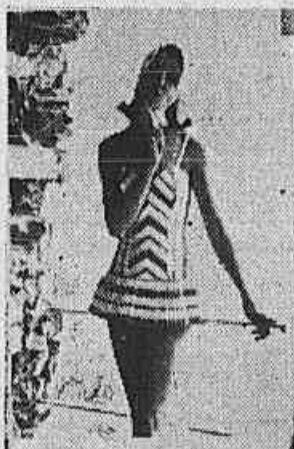
Em tecido de algodão listrado, este gracioso maiô para moças muito bonito o saiote pregueado.