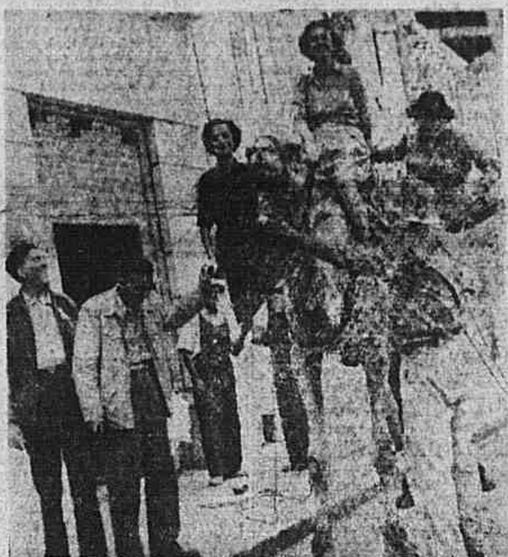
Peregrinos montados num camelo, animal bastante encontrado na ilha, substituindo o cavalo ou o burro

da a efeito pela oposição da maioria dos peregrinos, que vieram com recato o início de uma festa carnavalesca que poderia vir a perturbar o caráter religioso da ilha. (Conclui na 7.ª pág.)