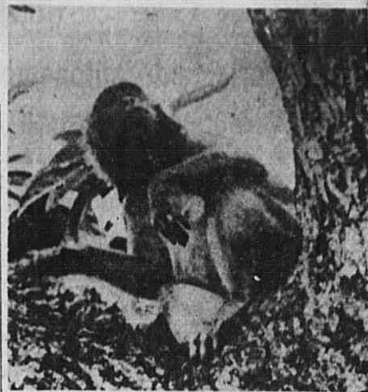
Este é da teoria: cada macaco no seu galho

Ambos os ministros insistiram na gravidade da ameaça comunista na Europa e no Extremo Oriente e disseram que o fortalecimento do mundo livre constitui a única esperança de proteger o país. Johnson disse que a aliança militar do Atlântico Norte e o programa de auxílio militar constituem "o único caminho que resta para a paz e a segurança", e acrescentou que a Rússia "fez com obstáculos vários os demais caminhos".