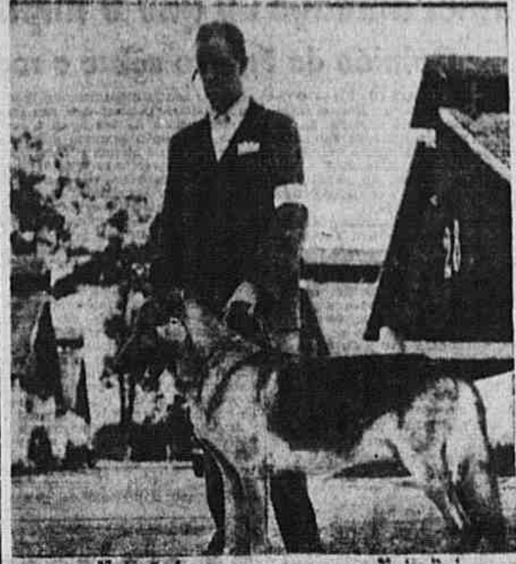
Melhor da Raca MELHOR DO 3.º GRUPO

Toda correspondência para esta seção deve ser dirigida ao dr. A. Barone — Redação de A MANHÃ — Rua Sacadura Cabral, n.º 43 — Rio de Janeiro — Brasil. Publica-se às terças e sábados, com noticiário geralizado do mundo canino.