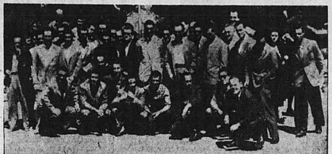
A CAMINHO DO BRASIL. OS BI-CAMPEÕES — Os italianos são os bi-campeões do mundo. Foram os vencedores dos certames de 34 e 38 e estão a caminho do Brasil, dispostos a trisar o feito. Os componentes da "Azurra", pouco antes do embarque, foram recebidos e abençoados pelo Papa. Na foto, vemos os atuais detentores do "Troféu Jules Rimet", pouco depois de terem prestado exame médico, a fim de viajarem para a nossa terra, onde chegarão no dia dezanove, no porto de Santos.

As autoridades e jornalistas que tomarão parte no raid retornarão a esta capital, depois de amanhã.