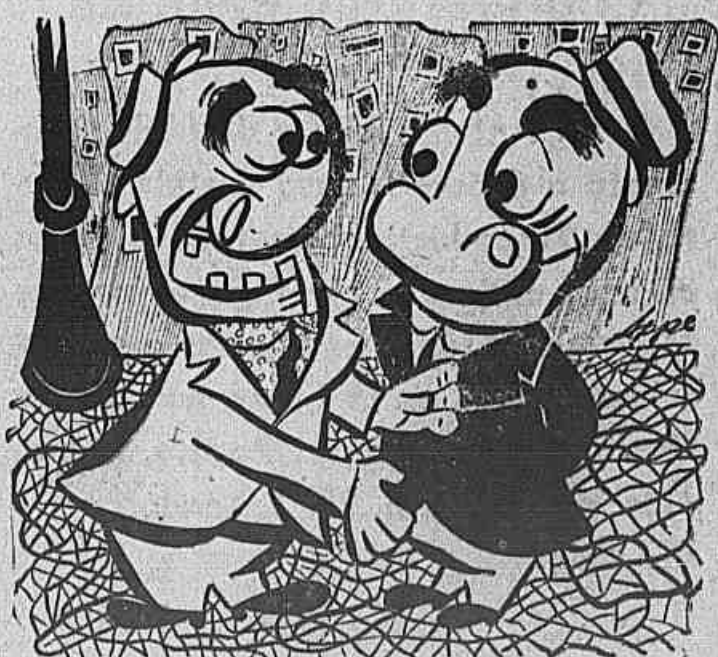
— Então, os ANJOS perderam as asas? — Que asas? Eles nunca tiveram asas.