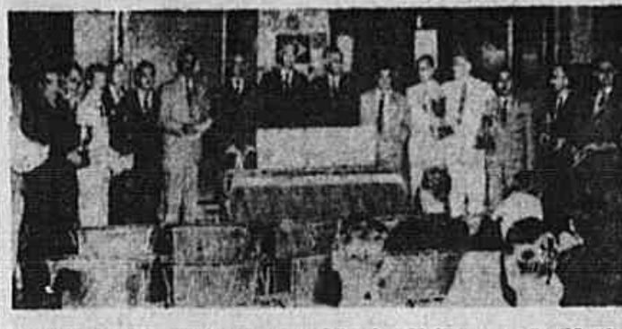
Vemos na foto os diretores sociais da Light e os presidentes da ADECA e dos clubes esportivos que foram receber os respectivos prêmios ganhos por seus clubes, durante os campeonatos de 1949

BOLSAS, MALAS? Só na "A BOLSA FINA", de camurça, desde Cr$ 70,00 "CONCERTOS, TINGIBEN-VOS E A FÉTTIOS. Fábricas Rua Miguel Couto n. 39 — Sob. — Tel 42-3377