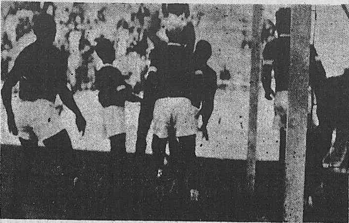
Scenas do interestadual de domingo, vendo-se ameaçada, pela "artilharia" mineira, a cidadella vascaina