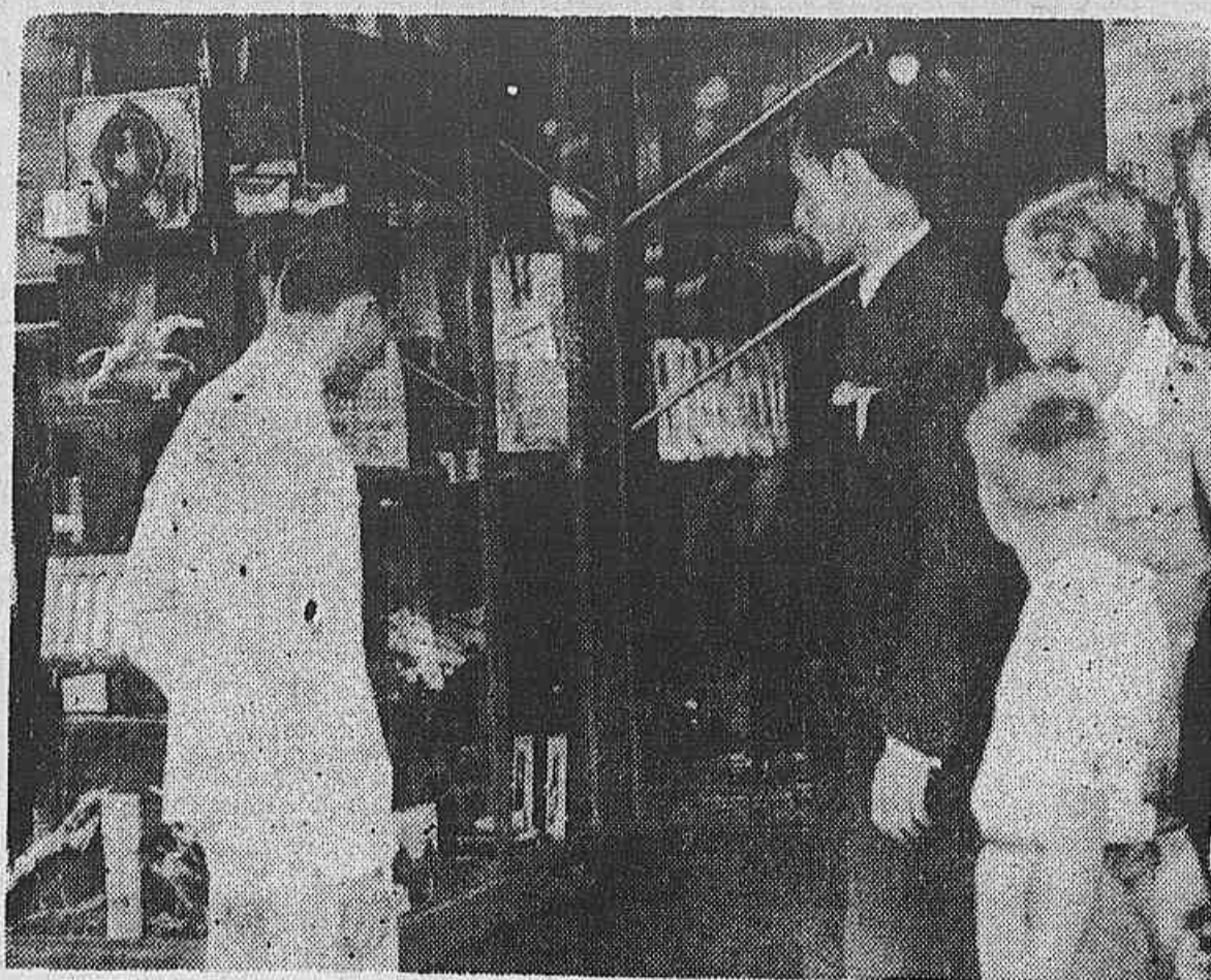
A vitrine da "A Caneta Carioca", que os ladrões "limparam" no domingo ultimo