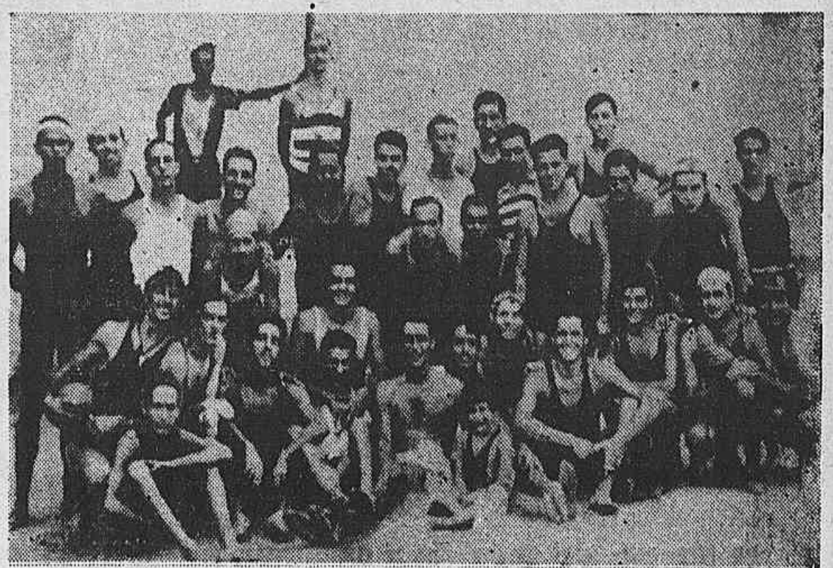
Os quadros de volleyball, concorrentes a o "Initium de Volleyball", do Grupo Aquatico dos Supimpas

O team Districto Federal lev antou o Initium de Volleyball