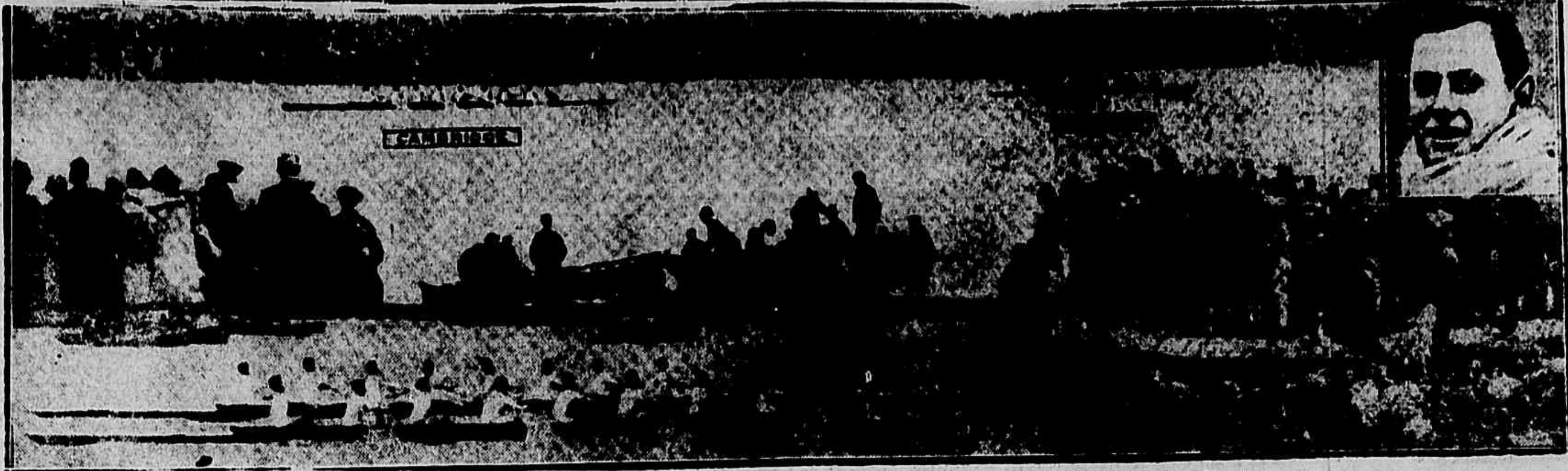
A chegada da famosa regata, no anno passado: Cambridge vence bem. Em baixo, os dois barcos emparelhados, no meio da corrida. No alto, á direita, o voga Elles, da guarnição vencedora