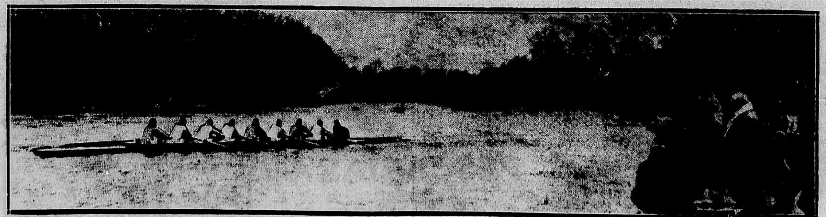
A guarnição de Cambridge, vencedora o anno passado, treinando um mez antes da corrida em Richmond, no Tamisa

VENDAS A LONGOS PRazos PELOS MENORES PREÇOS Officinas: para fabricação de peças, molas, engranagens, numeracion de cilindros de CAIXAS REGISTRADORAS e Máquinas de escrever TRABALHO GARANTIDO TABELLA ESPECIAL DE PREÇOS — ATENDE-SE A ENCOMENDAS Deposito e officina: CASA VOUGA — Tel. Norte 5056 RUA SENADOR EUZEBIO, 55 — Prédio do Príncipe da Republica