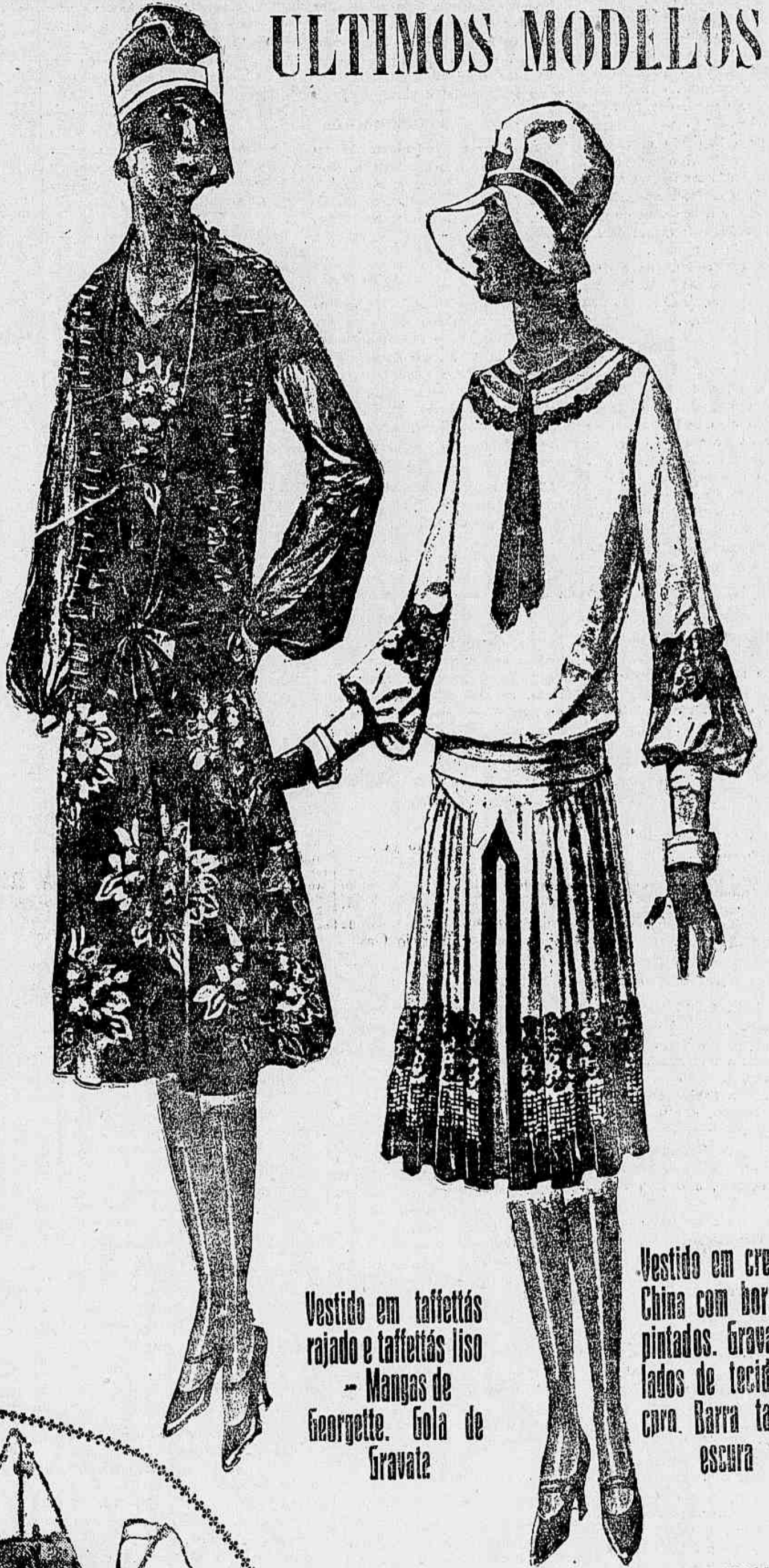
Vestido em taffettás rajado e taffettás liso - Mangas de Georgette. Gola de Gravata