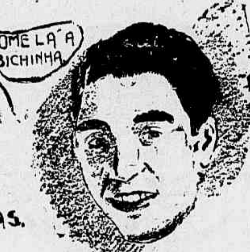
SAMMY MANDELL ACTUAL CAMPEÃO DOS LEVES.

UM DOS MAIS FORTES CONCURRENTES AO MESMO CAMPEONATO.