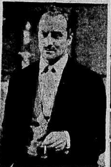
Um dos intérpretes de «O Destino em Apuro».

O Cinema Brasileiro entra em uma nova fase, apresentando seu primeiro filme colorido «O Destino em Apuro».