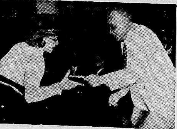
Um aspecto da reunião

Prosseguindo na execução do programa comemorativo da Semana da Economia, anualmente festejada nos últimos dias de outubro, foi realizado, ontem no salão da Biblioteca da Caixa Econômica local, o sorteio para repartir de 20 empréstimos dos penhores relativos a contratos de máquinas de costura e de escrever, instrumentos musicais e outros objetos ainda considerados utensílios de trabalho.