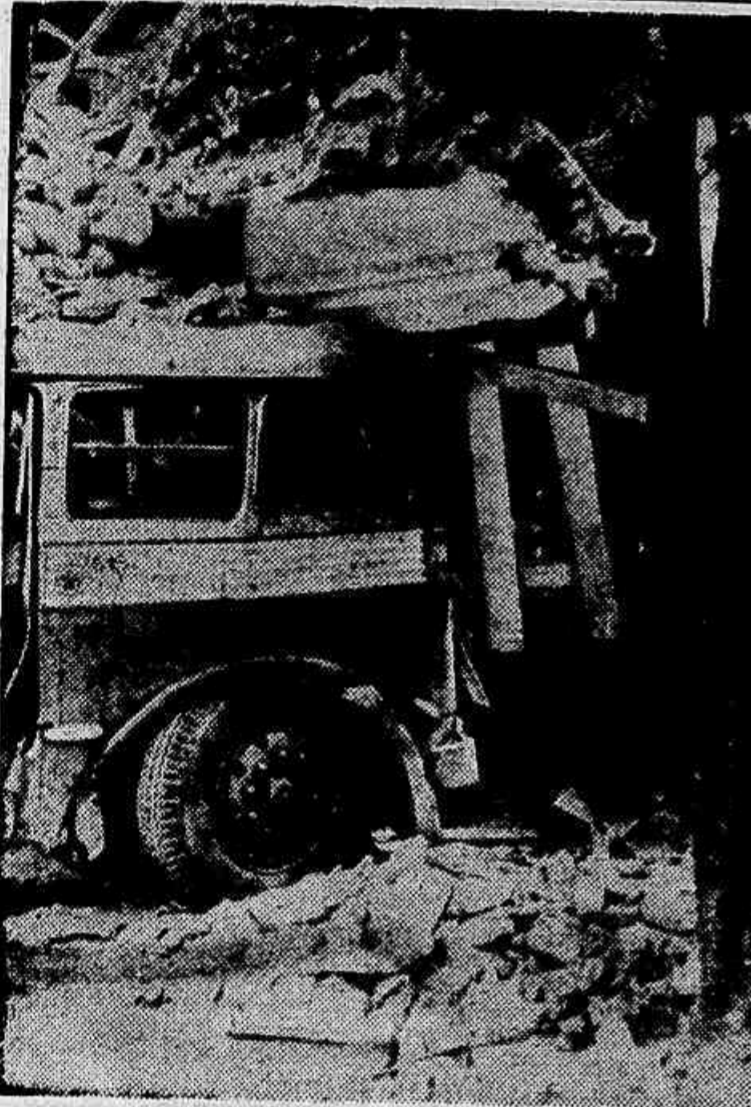
O ônibus entrou no bar

O sacerdote, dias antes, havia sido trancafiado num xadrez policial por estar empenhando na Caixa Econômica a máquina de escrever comprada sob reserva de domínio - Será suspenso pela Curia (Texto na página 5)