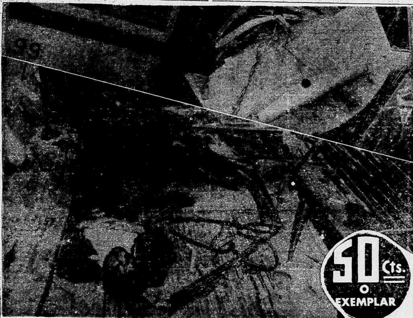
Aspecto impressionante do local do desastre, vendo-se no plano superior o estado em que ficou o ônibus e em baixo, o cadáver do motorista entre os destroços do bonde (TEXTO NA PÁGINA 5)