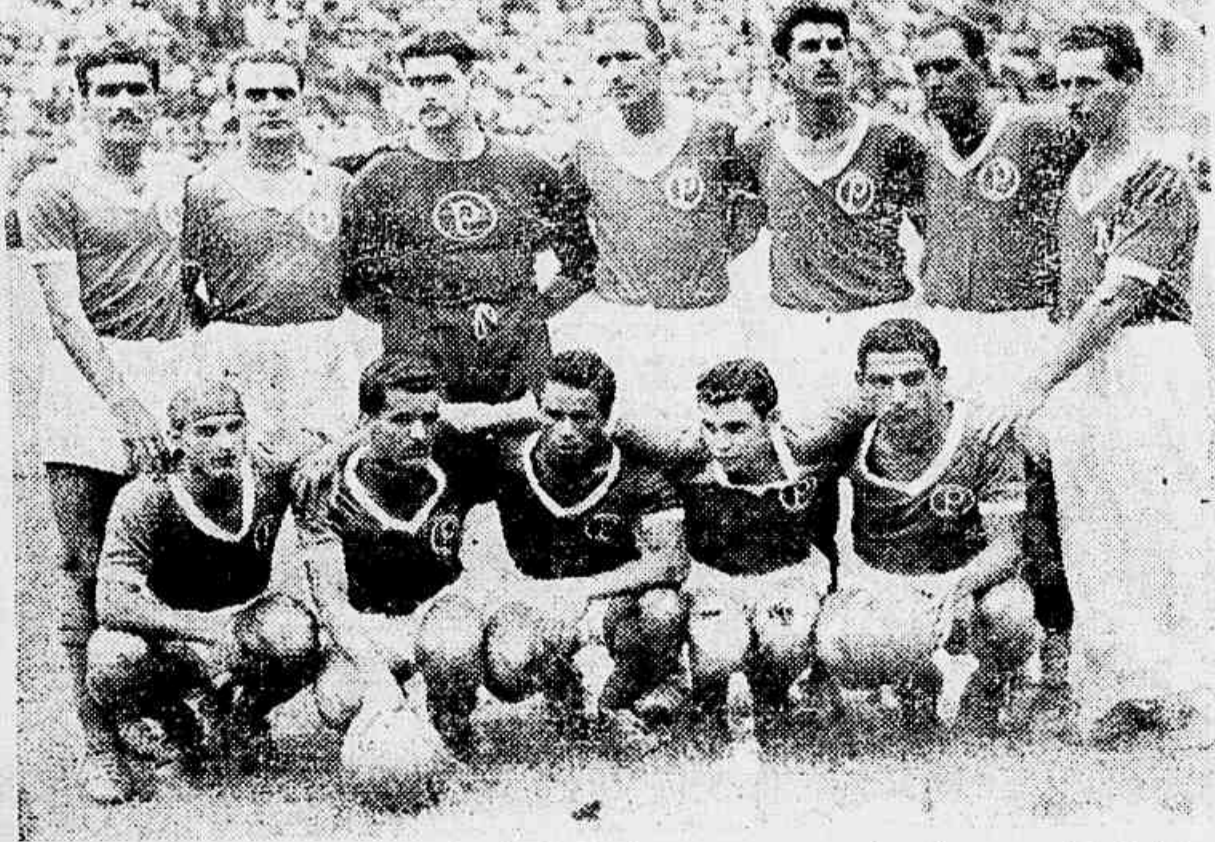
O conjunto "periquito", campeão absoluto de São Paulo e que aparece como favorito para a peleja de hoje

Salvo modificações de última hora, as duas equipes atuarão com a seguinte constituição. Nice F. C.: — Germain — F. — Ben Nacer — Beyer — Miodonei e Rossi — Courteux — Bonfari — Joso — Bengi son e Aialmarsson. Palmeiras: Oberdas — Salvador e Póante — Waldemar Fume — Luiz Vila e Dena — Lima — Lindaba — Agelles — J. J. e Cathodino.