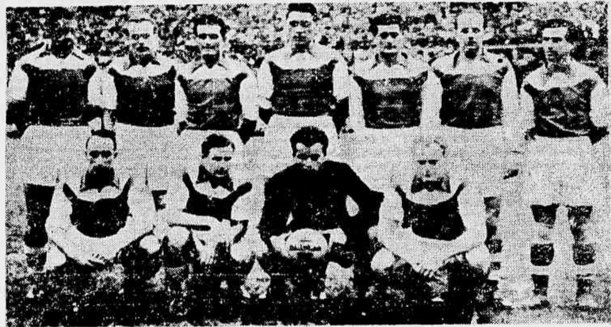
O poderoso conjunto do Áustria F. C., que hoje terá sua estréia no Torneio dos Campeões, entrando em campo a equipe do Nacional

Se o Nacional, de Montevideo, atrai a atenção do público por ser um quadro representa-