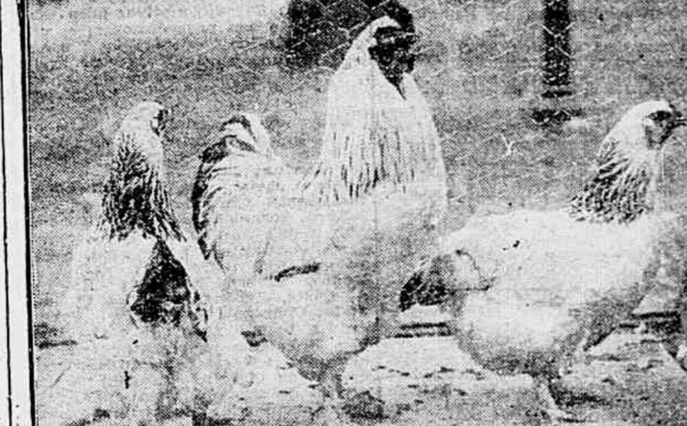
Um bello terno de galinhas de raça Brahma Pootra