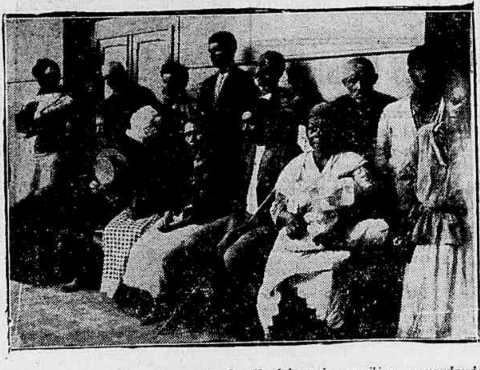
Um grupo de mendigos no saguão da 4ª delegacia auxiliar, aguardando destino