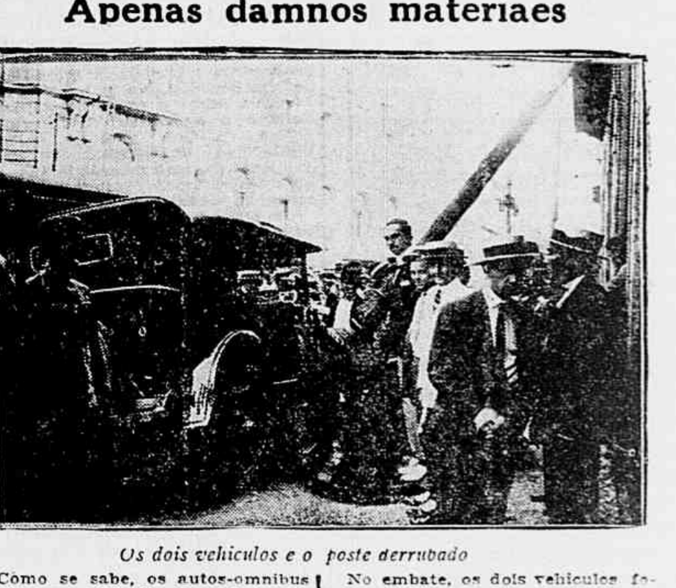
Os dois vehiculos e o poste derrubado