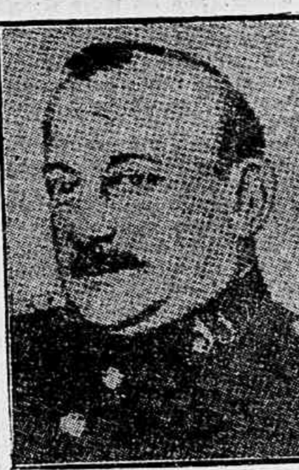
General Primo de Rivera, chefe do governo de Hespanha

O artigo que Ramsay Macdonald escreveu especialmente para a "Gazeta de Noticias", e que amanhã publicaremos, vai certamente concorrer para que a intellectualidade brasileira estabeleça um contacto mais intimo com o leader do Labour Party.