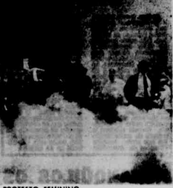
PROTESTO FEMININO GUAYACUIL, Equador — Amarelas bombas de gás lacrimogêneo, estas mulheres, correndo e correndo, prosseguem em suas manifestações. Protestam em elas contra a centralização dos fundos das instituições da Equador. Foram bastante aplaudidas por simpatizantes, nas ruas da cidade.

BUENOS AIRES, 20 (UPI) — O presidente da Câmara de Comércio Argentino-Basileira, Julio Raúl May, afirmou ontem que a Argentina tem o propósito de incrementar a exportação de trigo para o Brasil, até chegar a um milhão e meio de toneladas anuais. Num discurso pronunciado em almoço para comemorar o 49.º aniversário da fundação da entidade, May afirmou que o intercâmbio entre o Brasil e a Argentina, ocupa "um lugar de preferência". "Seu volume — disse — aproximadamente 50 por cento do intercâmbio de nosso país com as nações de zona de Associação Latino-Americana de Livre Comércio (ALALC).