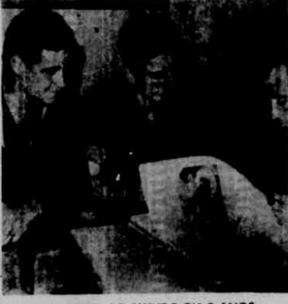
Volta ao mundo em 2 anos

FUTEBOL DE SALÃO Foi completado domingo último o turno inicial do estadual de futebol de salão promovido pela entidade salubridade que com a participação de seis agrupamentos pertencentes à divisão de honra de capital. A jornada inicial contou com 16 jogos, que assistiram aos seguintes: La Salle (1) x Orosio (1) — A.C.M. (2) x Barroco (0) — Tereza (3) x Wallby (0). Em campo ficou a posição dos concorrentes, por pontos negativos: líderes — G.E. Wallby e An. Cruz; 2.º — Mopos (1); 3.º — Tereza; 4.º — A.C. S.H. de La Salle (1); 5.º — Orosio; 6.º — G.E. Barroco (0). Domingo próximo, dia 25 do corrente, será travado a rodada de abertura da competição a serem realizados: A.C.M. x OFC — TIC x CRAB — G.E. x ANJELS.