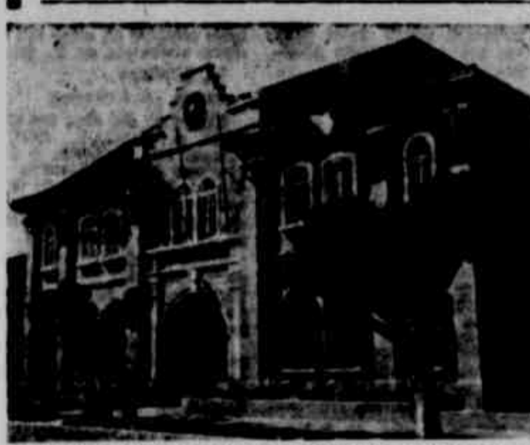
Fachada do atual quartel do 1.º Batalhão de Guardas da Brigada Militar do Estado, situado na Praia de Belas, unidade que hoje festeja mais um aniversário.