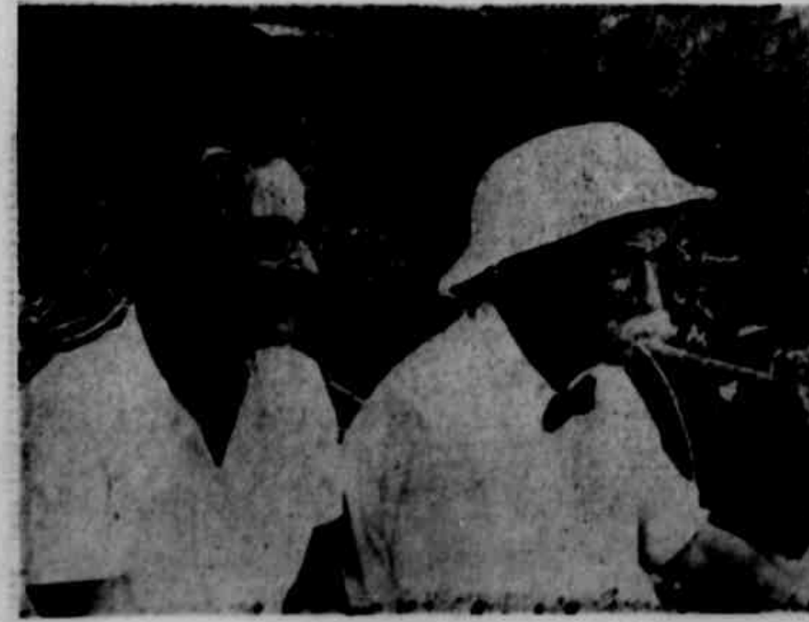
O MÉDICO DAS SELVAS

Albert Schweitzer, o grande gênio humano, há mais de 50 anos se empenhou na África, dedicando-se às gentes de Lambarene. Em público do Gabão, sua filha, srta. Rhena Eberle Schweitzer, conhece a sua obra e vem a Porto Alegre amanhã, para proferir três conferências quinta, sexta e domingo. No dia 25 dará, também, uma tarde de escuta para os alunos de sua pai, na Feira do Livro. Na foto o médico alemão com sua filha Rhena. (Noticiário na página 16)