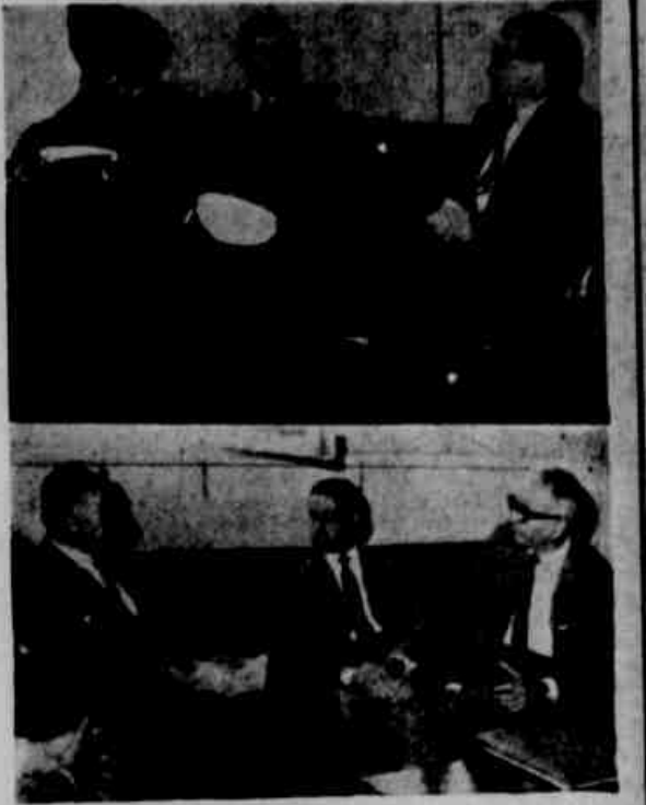
COMAND. DO "BARROSO PEREIRA" NA AL