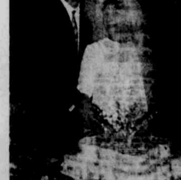
ENLACE SOUZA — CORRÊA