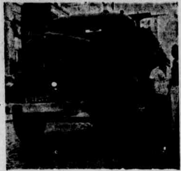
★ Este é o veículo que desceu a Rua Conceição, sem as travas, atravessou a Av. Alberto Bins e foi parar nas proximidades da Farrapos, local onde colidiu com uma carroça, matando o burrinho e ferindo o carroceiro.