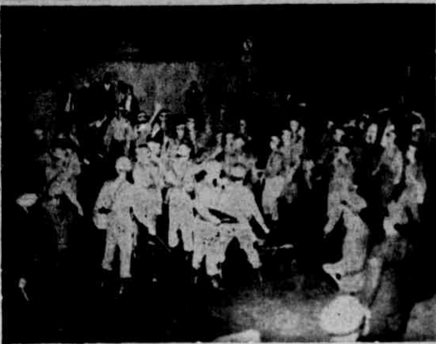
GEN. ALDEVIO: "PINHEIRO NETO É MENTIROSO"

SÃO PAULO — A reação democrática contra a insolência dos comunistas, que se tinham, já, hobiluado a passear seu ar de triunfo por todo o território nacional, ante a omissão de alguns governadores e a conivência de outros, aliada à do Poder Central, eclodiu em Minas e contagia, no momento, o Brasil inteiro, com manifestações diárias de repúdio ao Comunismo e seus métodos, bem como aos que lhe fazem o jogo através de comporta-