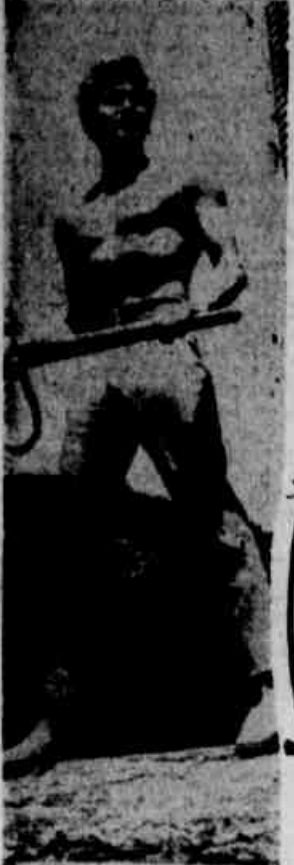
"Little Joe" é o caçula dos Cartwright, mas dá combate ao velho e os outros irmãos, na série filmada "Bonanza".

Não perca V. esta noite, mais uma oportunidade de assistir "Bonanza", oferecimento de Gessy-Lever.