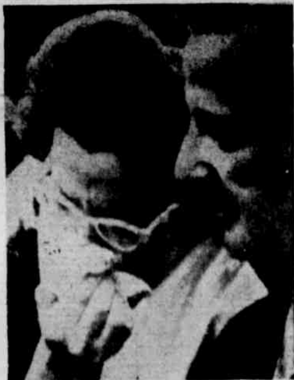
LÁGRIMAS POR JACK RUBY

velou a imprensa paulista. Essas fontes adiantaram ter o presidente da República desistido, de dar com insulto de aos trabalhos do Grupo designado pelo ex-ministro Carvalho Pinto para estudar o assunto.