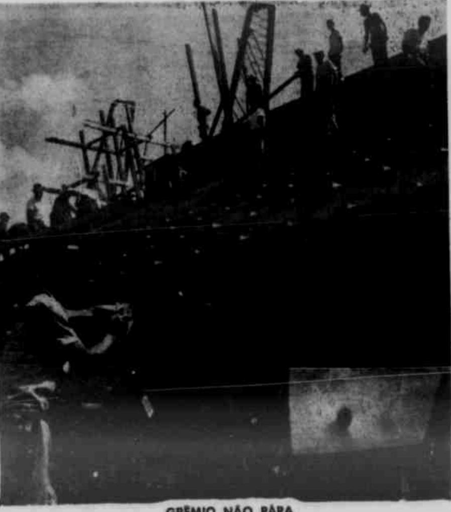
GRÊMIO NÃO PÁRA

A FRGCM fará realizar no próximo domingo, as duas últimas provas do calendário final da prova de curta duração, correspondentes às seguintes etapas de 1.000 metros contra relógio (transferido de domingo passado) e os 200 metros olímpicos. Referidas provas serão disputadas na Av. Fátima (trecho compreendido entre as ruas E. Pedro e S. Carlos), sendo ainda concedida a "reunião" às 10h30, no início da manhã. Seu início está marcado para as 7h30, sendo em primeiro lugar disputado os mil metros contra relógio. Competirão nestas últimas etapas as seguintes equipes: Grêmio P. Alagoinhas, C. B. Alagoinhas e C. B. Alagoinhas. A direção geral estará confiada ao sr. Governador Italiano, pres. de "maior" do pedal, auxiliado por um grupo de desportistas.