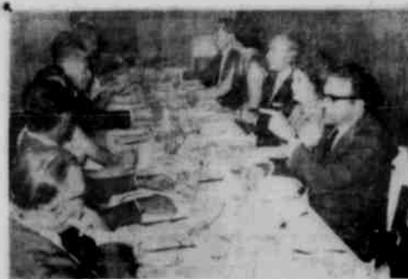
HOMENAGEM A GILBERTO MORAIS