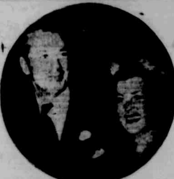
Gary Cooper, ao lado de sua esposa

Para a segunda do Instituto de Educação, foi transferida a exposição de artistas plásticos contemporâneos, que durante o ano de 1961 teve o seu ponto de partida no pavilhão de SETUBAL. Agora, a "Ilha de Educação" apresenta uma exposição de artistas plásticos contemporâneos, que durante o ano de 1961 teve o seu ponto de partida no pavilhão de SETUBAL. Agora, a "Ilha de Educação" apresenta uma exposição de artistas plásticos contemporâneos, que durante o ano de 1961 teve o seu ponto de partida no pavilhão de SETUBAL.