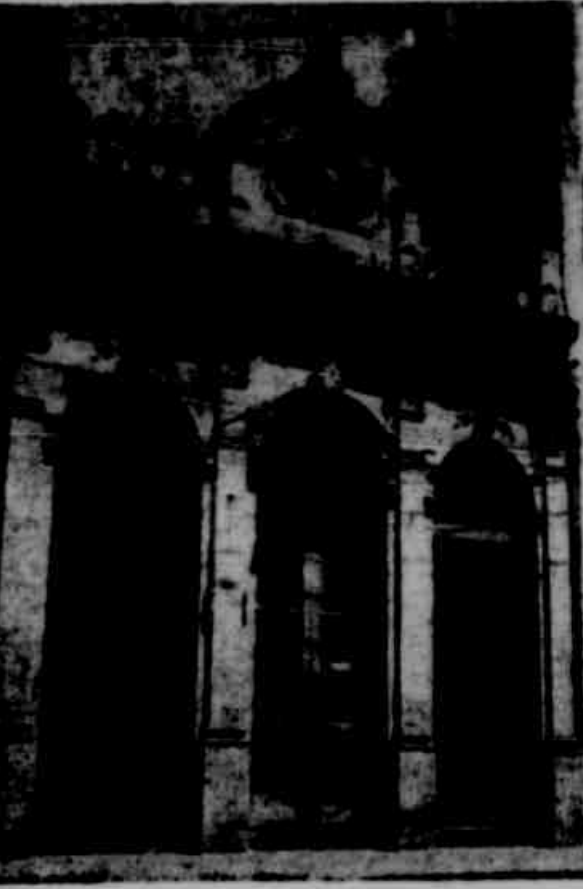
DENTRO DE 3 MESES, DROGARIA DO IPE EM PELOTAS — A loja nova e local onde deverá ser instalada...