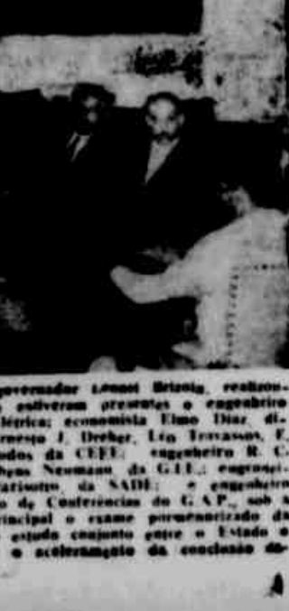
CENTRAL HIDRELÉTRICA DO JACUÍ — Convocada pelo governador Leonel Brizola...