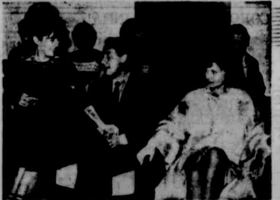
ASTROS E ESTRELAS — ROMA — Na solenidade efetuada no Clube de Imprensa estrangeira de Roma, para entrega do prêmio anual ao melhor filme estrangeiro, vemos da esquerda para a direita a estrela francesa Annette Stroyberg — esposa de Roger Vadim, o comediante italiano Alberto Sordi e a atriz húngara Eva Bartock, O pai de correspondentes estrangeiros concedeu o prêmio ao filme "Rocco e seu irmão", que aliás parcialmente impugnada pela censura italiana.

MASTROIANI CANDIDATO A PREMIO — ROMA — "La Dolce Vita" de Fellini, "Rocco e sua irmã" de Visconti e "Aventura de Antonia" de Fellini são os filmes que concorrem às "filas de pratas" dos críticos e jornalistas cinematográficos italianos para 1961.