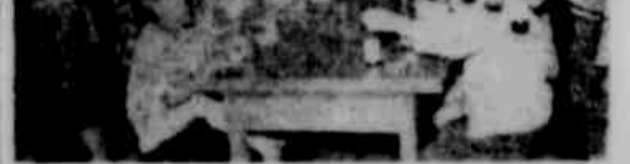
ERECHEM — Nesta cidade é digno de menção o trabalho de assistência social que promovem as esposas dos componentes do Rotary Club Erechense. Seguidamente fazem vasta distribuição de roupas e alimentos às famílias necessitadas, procurando minorar-lhes a aflição situação em que se encontram, dando eloquente prova de solidariedade humana. Por outro lado, procuram dar um pouco de alegria às crianças pobres, realizando belas festas, em que, prodigalmente, distribuem doces e refrigerantes. Na foto, flutuante de uma festinha que realizaram recentemente