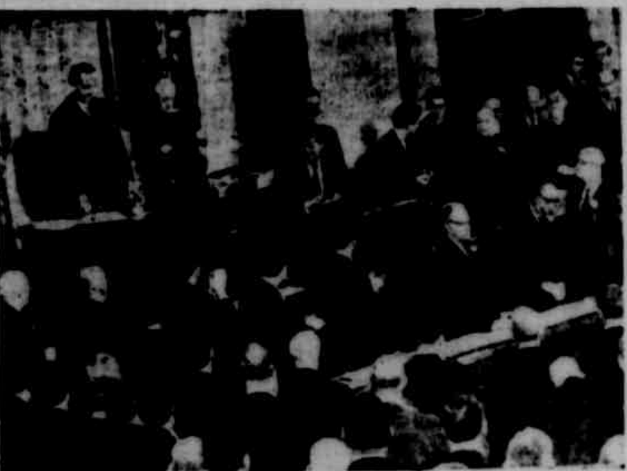
APLAUSOS PARA KENNEDY — WASHINGTON — O presidente John Kennedy é aplaudido pelos congressistas, em pé, antes de iniciar a leitura de sua mensagem sobre o "Estado da União" perante a sessão conjunta do Congresso. Atrás do chefe do Governo vê-se na tribuna o vice-presidente Lyndon Johnson (à esquerda) e o presidente da Câmara Sam Rayburn.

Outras testemunhas foram identificados também anonimamente como "S.", "B.", "D.", "E.", "F.", "G.", "H.", "I.", "J.", "K.", "L.", "M.", "N.", "O.", "P.", "Q.", "R.", "S.", "T.", "U.", "V.", "W.", "X.", "Y.", "Z.", "AA.", "BB.", "CC.", "DD.", "EE.", "FF.", "GG.", "HH.", "II.", "JJ.", "KK.", "LL.", "MM.", "NN.", "OO.", "PP.", "QQ.", "RR.", "SS.", "TT.", "UU.", "VV.", "WW.", "XX.", "YY.", "ZZ.", "AAA.", "BBB.", "CCC.", "DDD.", "EEE.", "FFF.", "GGG.", "HHH.", "III.", "JJJ.", "KKK.", "LLL.", "MMM.", "NNN.", "OOO.", "PPP.", "QQQ.", "RRR.", "SSS.", "TTT.", "UUU.", "VVV.", "WWW.", "XXX.", "YYY.", "ZZZ.", "AAAA.", "BBBB.", "CCCC.", "DDDD.", "EEEE.", "FFFF.", "GGGG.", "HHHH.", "IIII.", "JJJJ.", "KKKK.", "LLLL.", "MMMM.", "NNNN.", "OOOO.", "PPPP.", "QQQQ.", "RRRR.", "SSSS.", "TTTT.", "UUUU.", "VVVV.", "WWWW.", "XXXX.", "YYYY.", "ZZZZ.", "AAAAA.", "BBBBB.", "CCCCC.", "DDDDD.", "EEEEE.", "FFFFFF.", "GGGGG.", "HHHHH.", "IIIII.", "JJJJJ.", "KKKKK.", "LLLLL.", "MMMMM.", "NNNNN.", "OOOOO.", "PPPPP.", "QQQQQ.", "RRRRR.", "SSSSS.", "TTTTT.", "UUUUU.", "VVVVV.", "WWWWW.", "XXXXX.", "YYYYY.", "ZZZZZ.", "AAAAA.", "BBBBB.", "CCCCC.", "DDDDD.", "EEEEE.", "FFFFFF.", "GGGGG.", "HHHHH.", "IIIII.", "JJJJJ.", "KKKKK.", "LLLLL.", "MMMMM.", "NNNNN.", "OOOOO.", "PPPPP.", "QQQQQ.", "RRRRR.", "SSSSS.", "TTTTT.", "UUUUU.", "VVVVV.", "WWWWW.", "XXXXX.", "YYYYY.", "ZZZZZ.