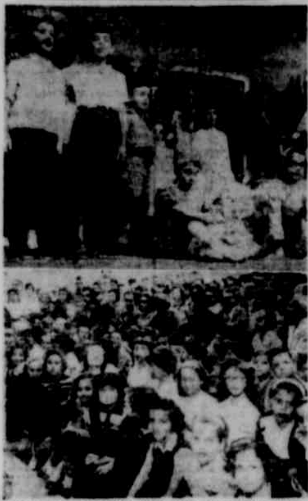
"DIA DO PAI" NO GIN. FARROUPILHA