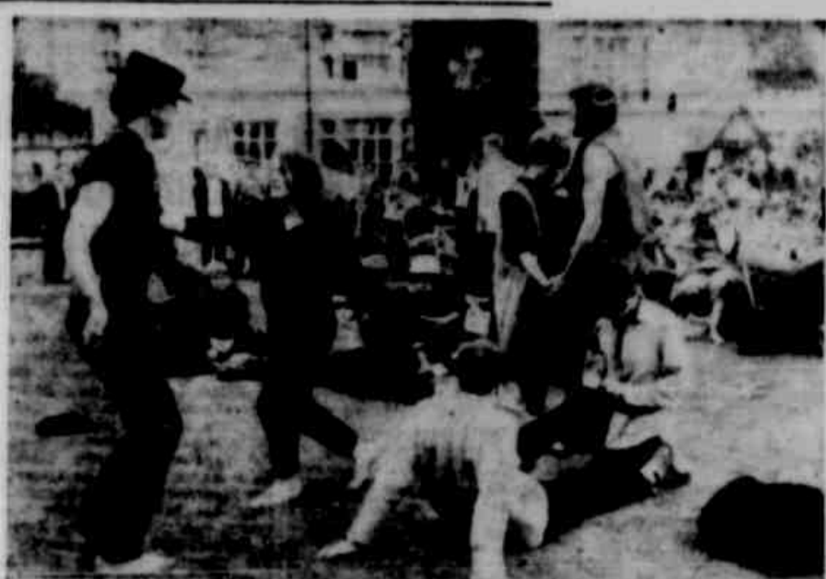
JAZZ E PRECAUÇÕES — HAMPSHIRE — Inglaterra — O festival de jazz nesta cidade, dá grandes dores de cabeça às autoridades. Vinte mil jovens se reúnem anualmente, cantam, quebram cadeiras e instrumentos. A polícia, com auxílio de cães treinados, não tomar conta deles, este ano.