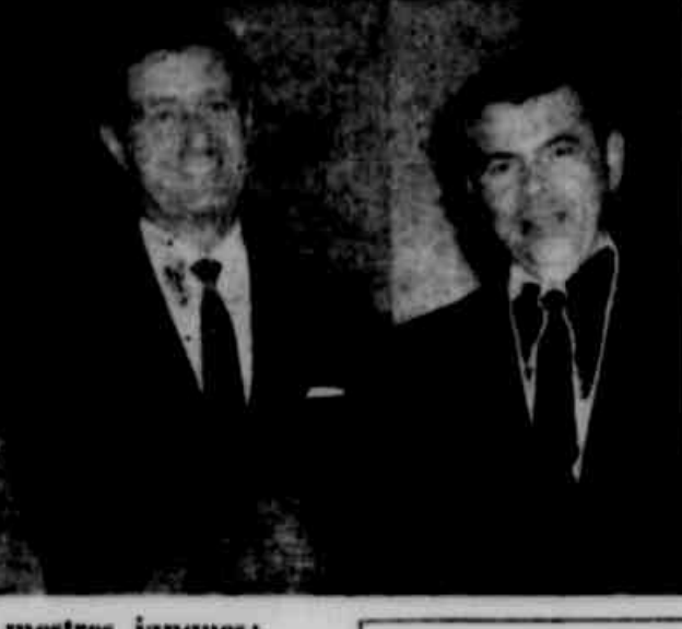
Chegaram os mestres ianques: Administração Universitária