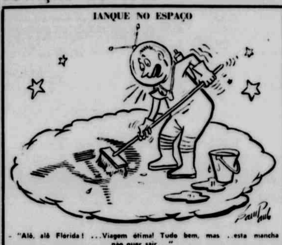
"Alô, alô Florida! ... Viagem ótima! Tudo bem, mas esta mancha não quer sair..."