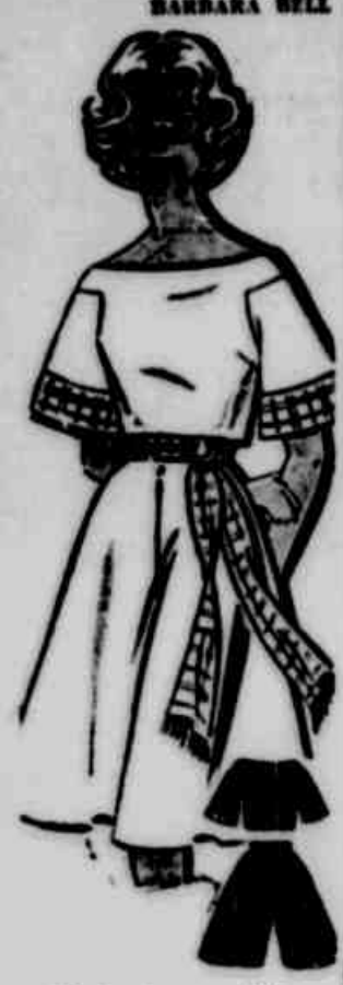
Elegância nas férias