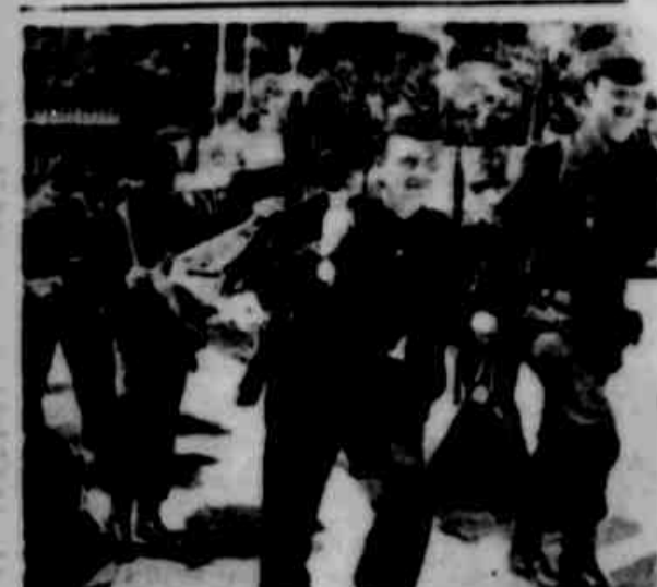
Substituídos os para-queidistas — Argel — Guardas de segurança passam a ocupar a sede do Governo Geral da Argélia, depois da retirada dos para-queidistas que participaram da fracassada revolta contra o presidente de Gaulle.

SAO FRANCISCO 3 (UPI) — O presidente do Partido Comunista, Fidel Castro, afirmou hoje que as vitórias do comunismo na América Latina são resultado da política míope dos Estados Unidos.