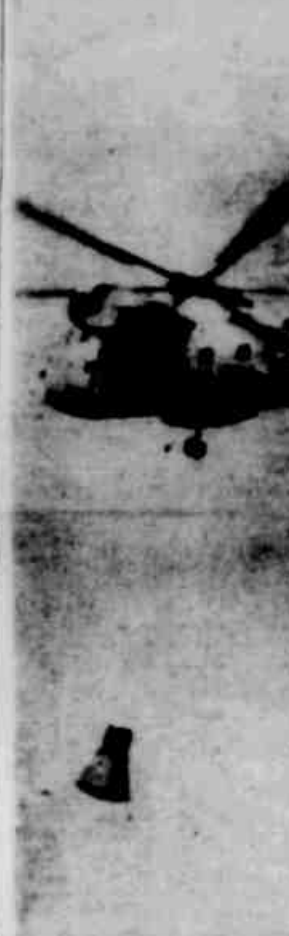
Pescando a cápsula ILHA WALLOPS (Virgínia, EUA) — Um helicóptero traz a chamada cápsula do espaço "Mercury", pescada no Atlântico, depois do seu último lançamento experimental ao espaço. Essa foi a última preparação para o lançamento do primeiro astronauta norte-americano, dentro da mesma cápsula. A operação do recolhimento, ontem, aconteceu rigorosamente dentro do que estava previsto.