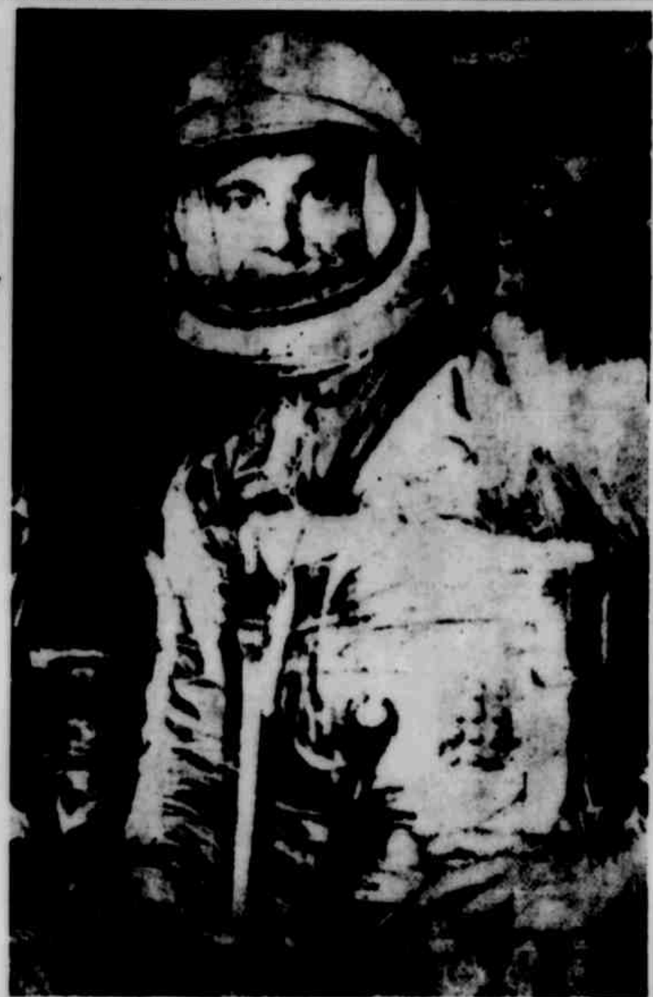
Shepard vestido para ingressar na história

COBERTURA — Não temos mais para afirmar se foram, através da Rádio Farroupilha, o primeiro a transmitir a informação histórica feita. Mas a síntese acima espelha com fidelidade o que, foi comunicado mais exatamente com precisão, segurança e rapidez.