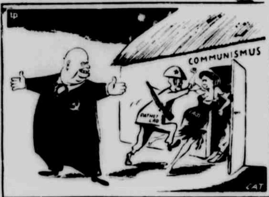
— Rápido, rapazes! Tenha pressa com essa brincadeira... —

Destacou que os refugiados cubanos podem ajudar nas forças armadas do E. U., mas ressaltou que não há intenção de preparar qualquer força especial cubana como tal. O presidente expressou também sua satisfação pelo maior reconhecimento na Hemisféria Ocidental da necessidade de prevenir as tentativas de primeiro mundo cubano. Fidel Castro, de arribal a esta região, é injusta na comparação de sua legítima aspiração a uma vida melhor. Dando aos 300 repórteres presentes um endereço, Kennedy disse que há alguns aspectos positivos na situação mundial, apesar das dificuldades militares de várias partes do mundo. Mencionou sua esperança de que se realize a Organização do Tratado do Atlântico Norte (OTAN), sua confiança em restabelecer as relações com a Índia e o desejo de que o progresso da Índia em sua terceira ano do plano quinquenal de desenvolvimento econômico. Quando aos conselhos do presidente da Comissão de Relações Exteriores do Sena-