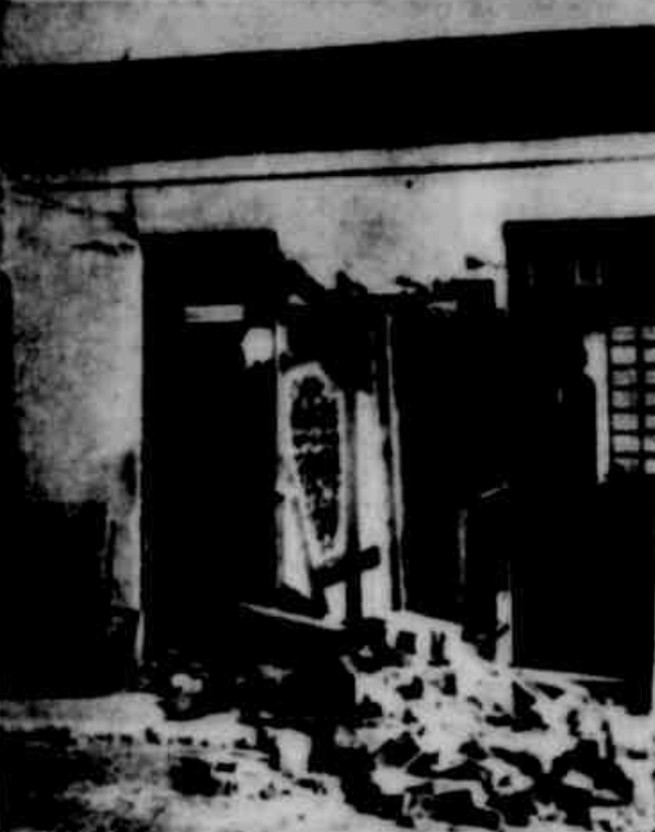
Aspecto da casa destruída para o Corpo da Guarda no 6.º BE, atingida por um ônibus, na manhã de ontem. Felizmente não houve feridos graves.