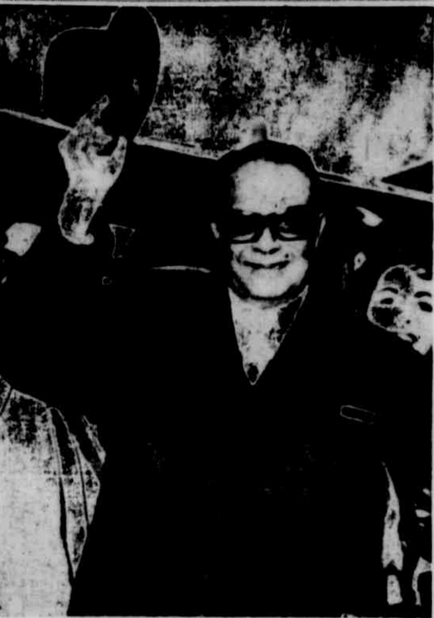
JOSE MIRO CARDONA, escolhido pelos aliados cubanos no EUA presidente do Governo Provisório do seu país...