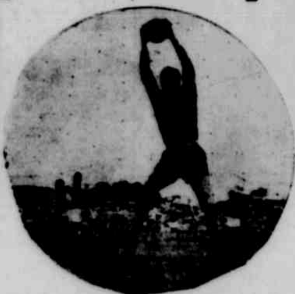
CESTARI foi, novamente, um bom arqueiro e embora traido duas vezes, cumpriu atuação destacada...