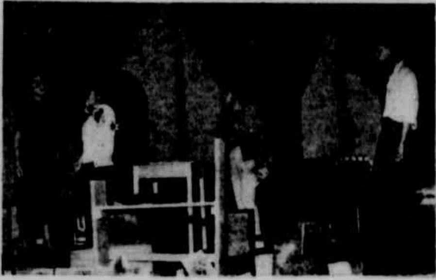
Uma cena do ensaio de ontem à tarde, no Teatro São Pedro. O Teatro de Arena promete realizar uma temporada inesquecível em Porto Alegre: bom repertório, bons diretores, bons atores e bons técnicos; tudo, enfim, para resultar em grandes espetáculos, dignos de ser aplaudidos pelo nosso público.