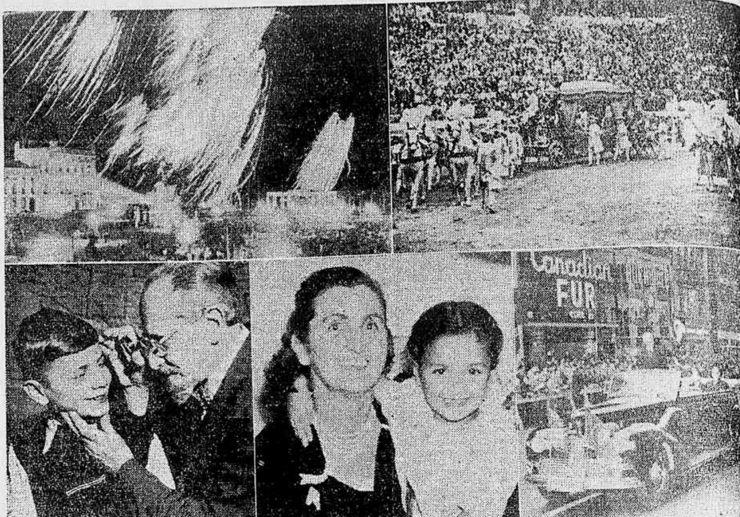
O QUE VAI PELO MUNDO — As duas ditaduras da Península Ibérica tiveram oportunidade de trocar idéias e demonstrações de boas vontades, por ocasião da recente visita do "cuadrillo" espanhol a Lisboa...