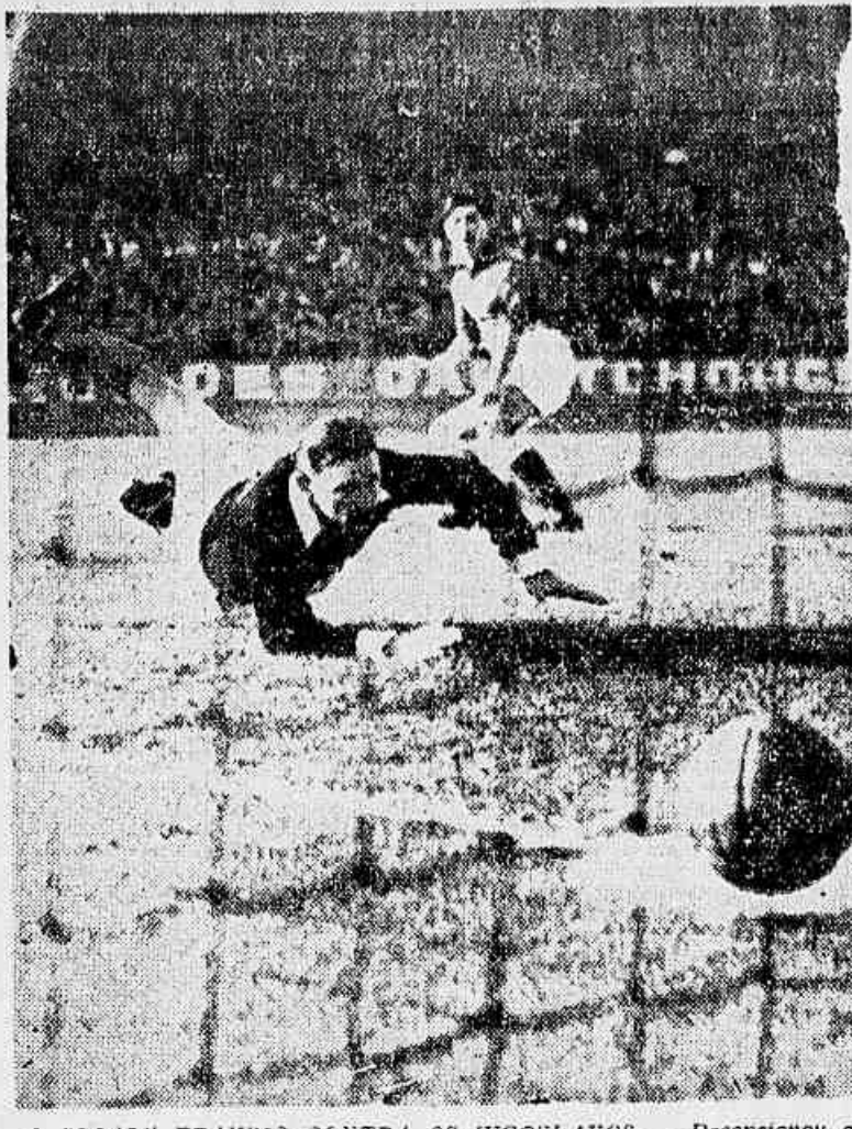
O "GOAL" FRANCÊS CONTRA OS IUGOSLAVOS - Decaptação e crítica francesa o resultado da segunda partida França-Iugoslávia...