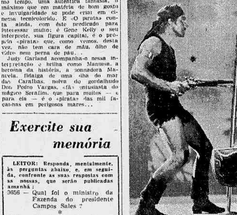
Gene Kelly numa cena de «O Pirata»