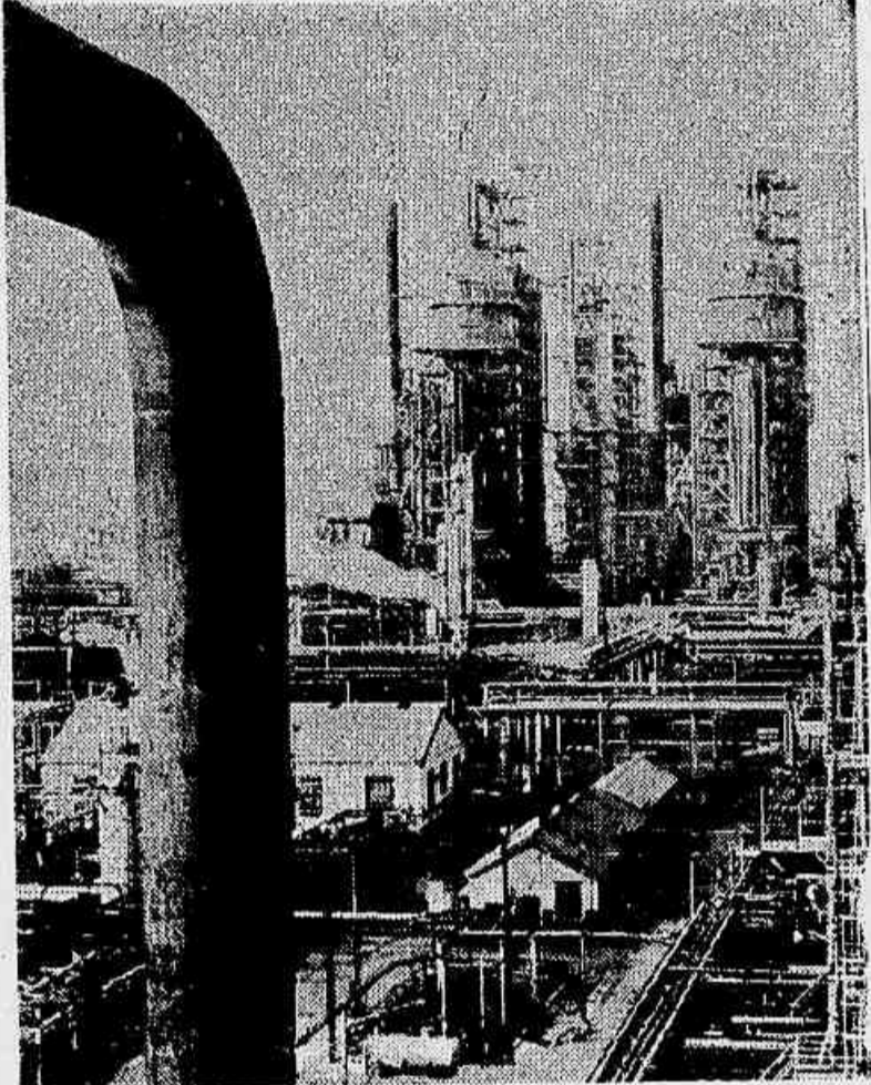
As três grandes torres das unidades de fracionamento catalítico, que separam 105.000 barris diários de petróleo bruto, em Baton Rouge.

(Extrato especial do Diário de Notícias nos Estados Unidos)