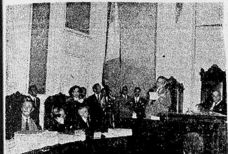
NO TRIBUNAL DE RECURSOS — Realizou-se, ontem, no Tribunal Federal de Recursos, expressiva homenagem à memória de Ruy Barbosa, como parte das comemorações que vêm sendo levadas a efeito em todo o país. Durante a sessão usaram da palavra vários oradores.

Comemorações levadas a efeito de norte a sul do país — Prosseguem as homenagens nesta capital — Solenidades de formatura de bacharéis — Congresso de Direito Constitucional