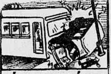
VÍTIMAS DO TRÁFEGO (MORTOS NESTE MÊS)