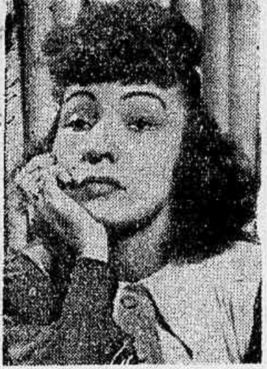
Dulcina de Moraes