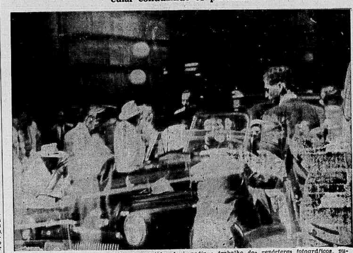
Apesar dos esforços dos policiais no sentido de impedir o trabalho dos repórteres fotográficos, puderam estes fixar este flagrante da ruindade dilapidada que gerou o tráfego em frente à Light, vindo-se o carro-chapa particular 1-32-76 que conduziu os presos.

Repetiram-se ontem as cenas deploráveis de 17 de dezembro, que não tiveram das autoridades as providências merecidas — Prêso novamente, em serviço, o funcionário portador de um "habeas-corpus" — Como as arbitrariedades impunes geram novas arbitrariedades — Um automóvel particular conduzindo os policiais