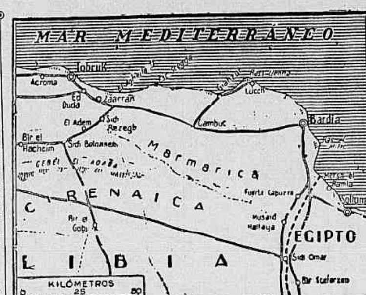
Este mapa da zona oriental da Líbia ilustra a atual deslocação militar no norte da África, onde as forças britânicas abandonaram as posições de El Adem e Sidi Rezegh, permitindo um novo assédio do Eixo contra Tobruk

SANTIAGO DO CHILE, 19 (U. P.) — O Partido Radical do distrito da capital, depois de debater durante várias semanas a situação internacional, aprovou por aclamação uma moção pela qual pede ao governo que rompa suas relações diplomáticas com as potências do "Eixo", expulse os diplomatas dessas nações e elimine os elementos da "quinta coluna".