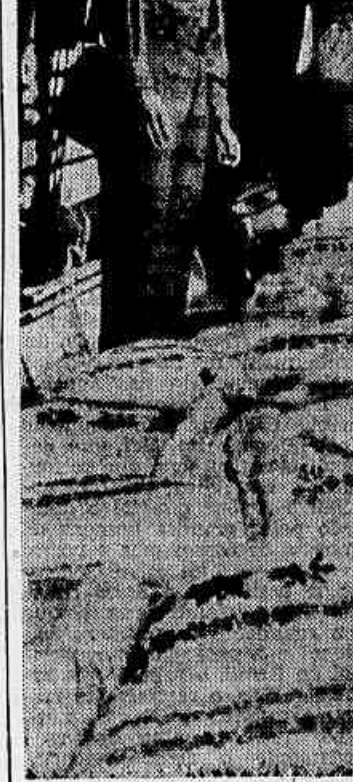
TEIPEI, Formosa - Sacos de arroz adaptados à fuselagem de aviões C-47 são mandados pelos chineses nacionalistas de Formosa...