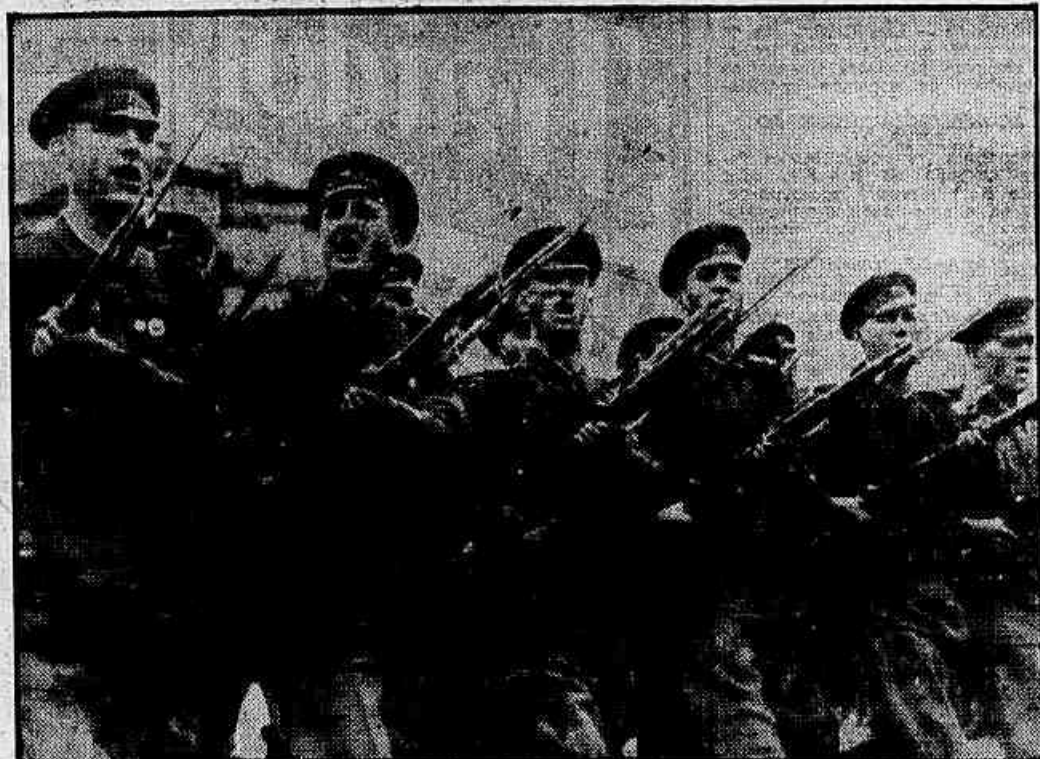
SOFIA - As tropas do exército búlgaro treinadas por comandantes soviéticos desfiliam à maneira característica destes nesta capital...