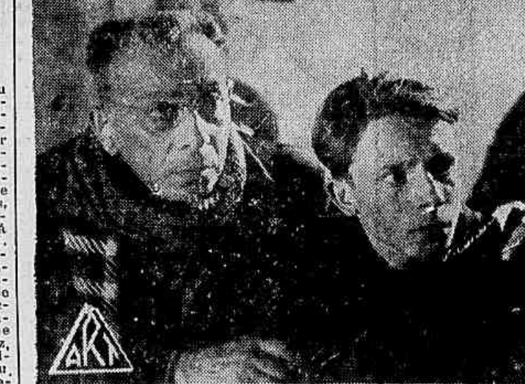
Eric Von Stronheim e Serge Grave numa scena do film "Mysterio do Collegio" que o Pathé Palacio entrará a seguir

"Mysterio do Collegio" com a sua intriga original, o seu ritmo envolvente e o imprevisível das suas situações, mereceu a atenção de todos os pais de todos os educadores e de todos os garotos maiores de 14 anos.