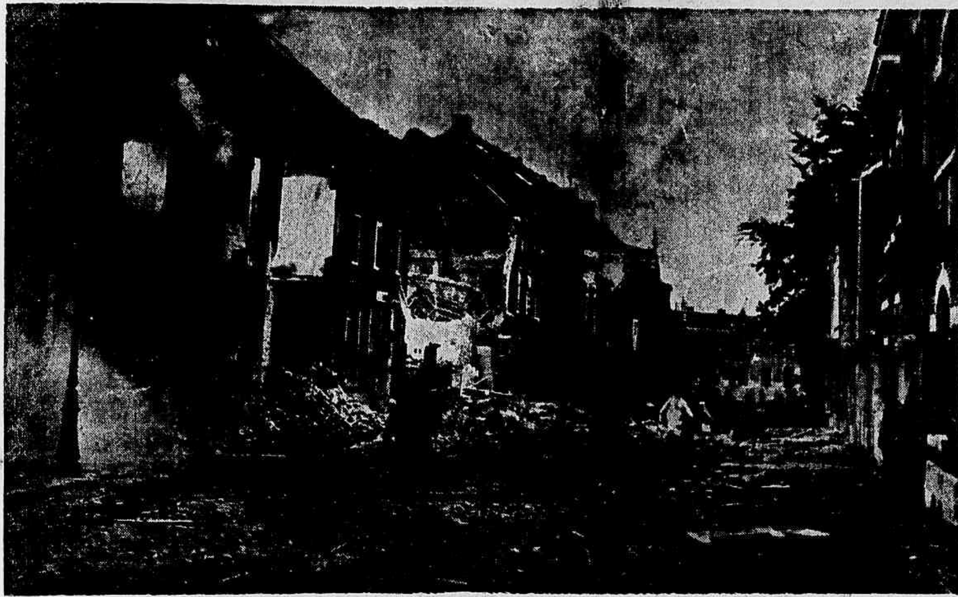
Este espectáculo é commum, hoje, na França: cidades inteiras devastadas, impiedosamente pela aviação do Reich, quer nas proximidades do "front", quer na retaguarda da grande nação latina. Enfrentando um inimigo superior em numero e equipamentos, a patria de Poch e Joffre não podia pensar em represália, pela a sua aviação era empregada na luta contra as columnas motorizadas das do inimigo. Entretanto, se guido os ultimos telegrammas, a brava "Royal Air Force", que e conta, ainda, com o mesmo poderio, tem se empenhado de levar ás retaguardas allemãs os humilhantes aereos, destruindo depositos de petroleo, fabricas, entroncamentos ferroviarios, aerodromos e os seus objectivos militares, pon do, assim em pratica as palavras de Churchill: "De vemos lutar, agora, como pro fissiones".