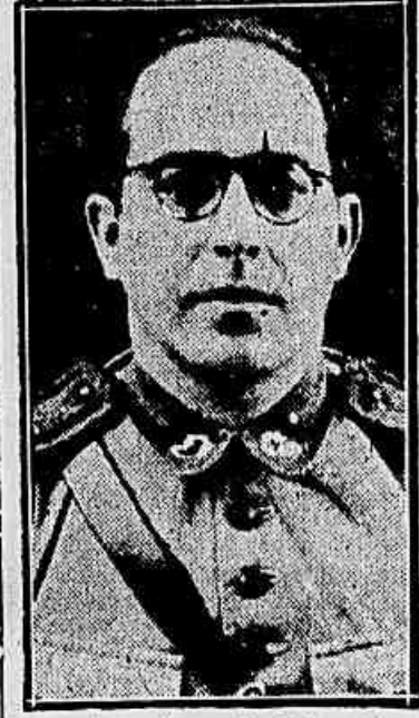
Interventor Cordeiro de Faria

PORTO ALEGRE, 19 (A. N.) — Noticia a imprensa que deverá viajar com destino ao Rio, o coronel Cordeiro de Faria, interventor federal no Estado. A viagem do chefe do governo riograndense é motivada pela realização, no proximo mez de julho, na capital da Republica, da Conferencia Nacional de Economia e Administração, em que serão discutidas todas as conclusões das conferencias realizadas nas diferentes zonas geo-economicas do paiz.