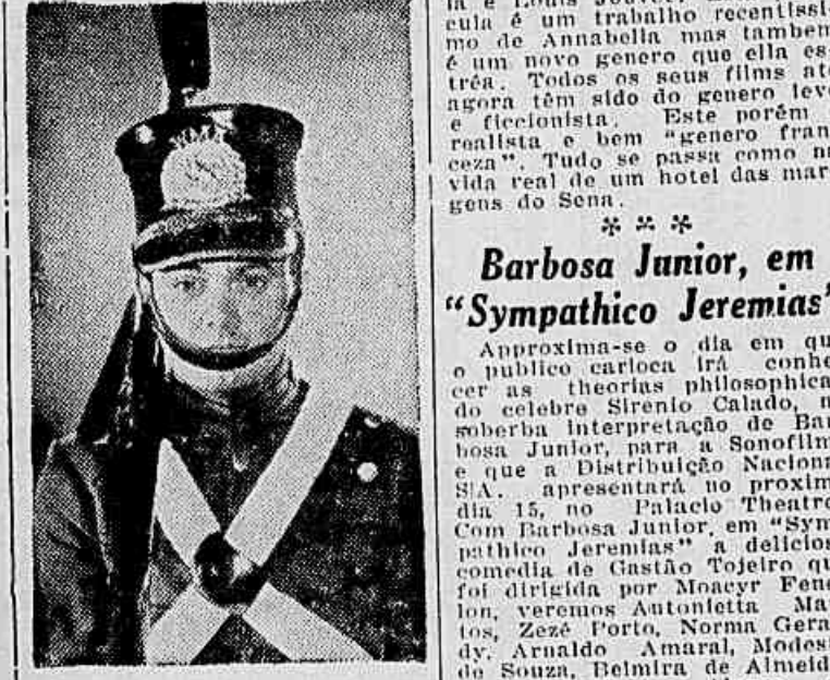
Um dos anjos de enra seja que veremos em "Os Anjos Acertam o Passo"

Se podiam ou não, ignoramos, mas a verdade é que agora, aquela turma terrível vai andar às direitas, no "batuete" o dia todo e sem aquelas andrajadas, aquelas gargalhadas horróricas e mancos como carneirinhos. Mas até!