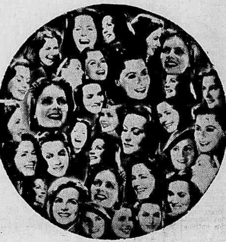
Tres dezenas de "momentos" de alegria de Greta Garbo em "Ninotchka"