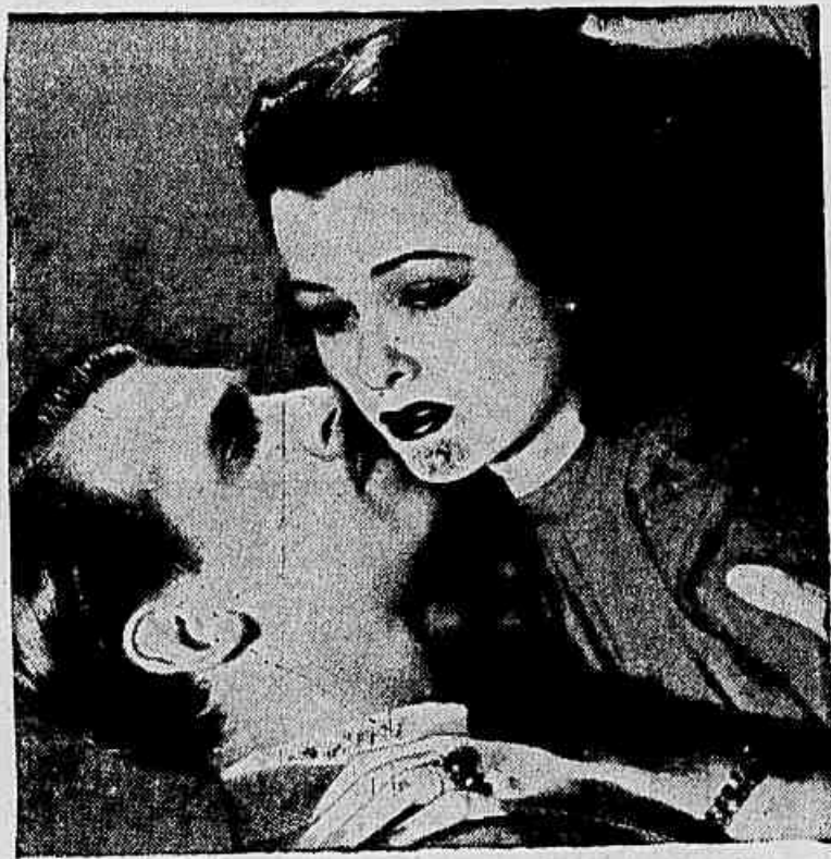
Douglas Fairbanks Jr. e Joan Bennett em "Inferno Verde", que estreia hoje no Plaza