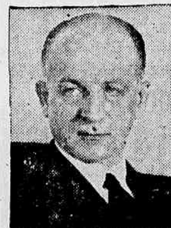
Sr. Sumner Welles WASHINGTON, 19 (U. P.) — O sub-secretario de Estado,

sr. Sumner Welles, revelou que as notas do governo dos Estados Unidos propondo um a reunião de emergencia dos representantes dos paizes americanos foram entregues aos governos latino-americanos na segunda-feira, simultaneamente com a entrega das notas enviadas a Roma e a Berlim, relacionadas com a doutrina de Monroe.