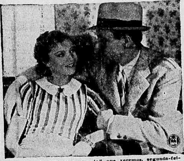
Uma scena de "Hotel do Norte" que veremos, segunda-feira no Broadway