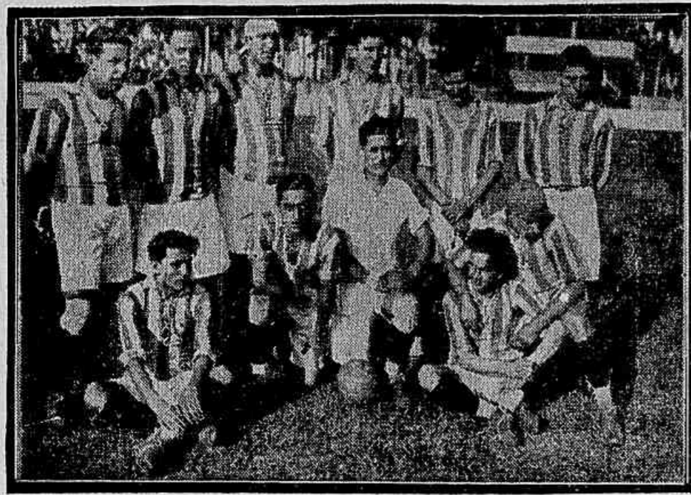
Os elementos do S. C. Syrio, que empatarem com os do Sant'Anna, hontem, por 2 pontos, em disputa de mais um jogo do campeonato da Liga de Amadores.