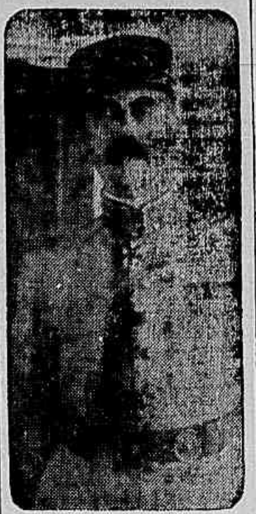
O GENERAL COFFEC, novo chefe da missão militar franceza instrutora do nosso Exército, ha pouco chegou ao Rio de Janeiro.

Lobe, pelo zelo e competencia demonstrados na organização do quadro e especificando a produção de algodão e a sua despesa realçada, em 1924, no referido Campo e, tambem, pela operosa e intelligente actividade manifestada no desempenho do cargo.