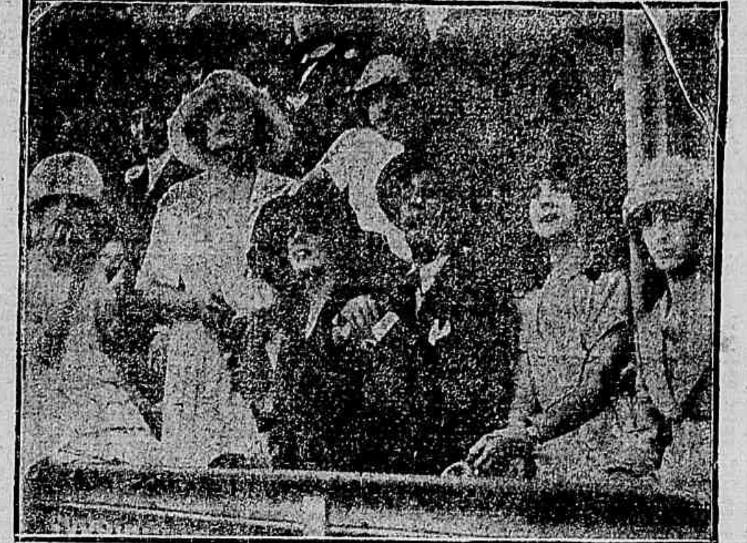
Uma "torcida" sensacional no Jogo do Palestra-Lines — Pelas attitudes das gentis "torcedoras", o leitor percebe que estamos deante de um dos lances épicos dos gathardos campeonos paulistas.