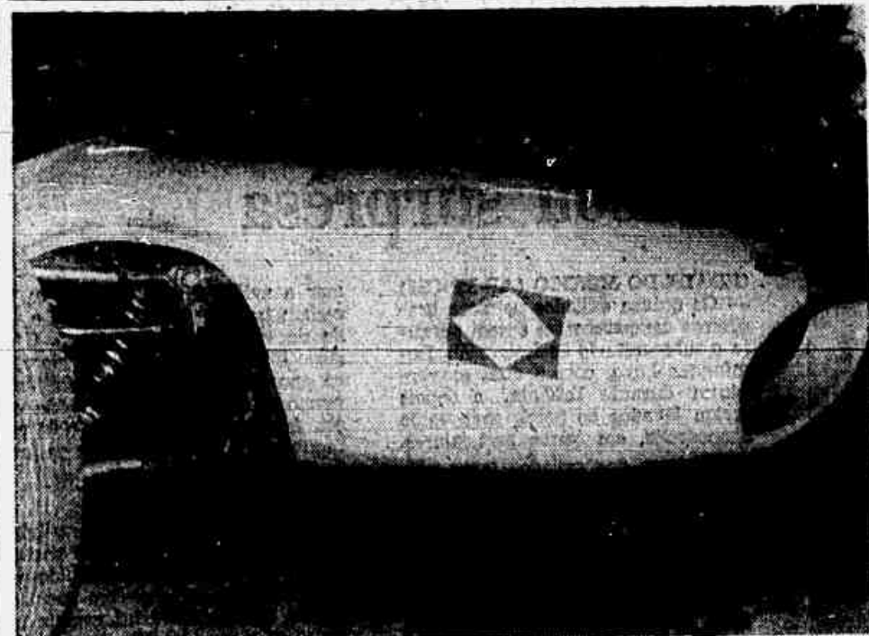
Pilotos brasileiros na Europa correm com as cores do Brasil e bandeira no carro