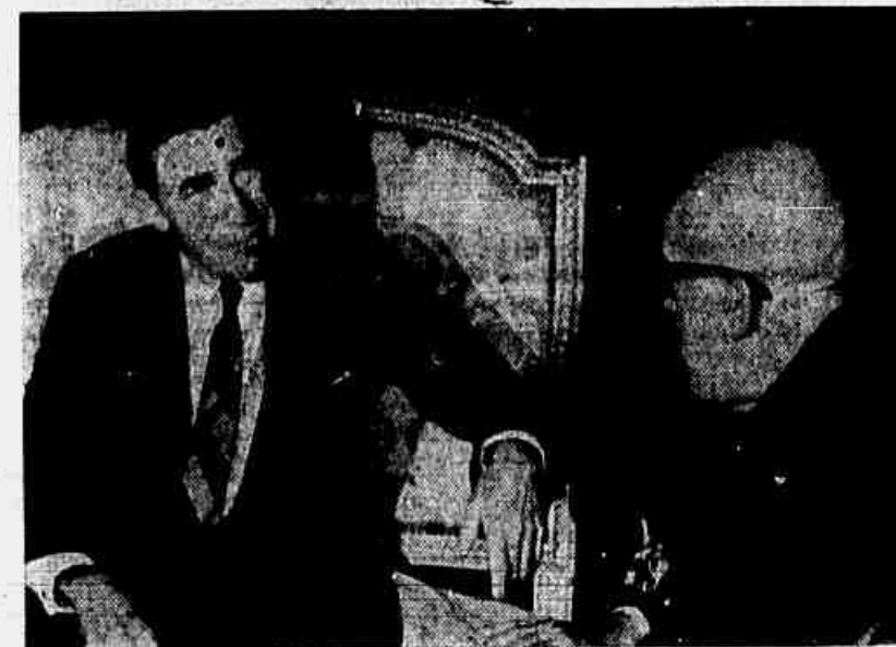
Embaixador Burke Elbrick contou para os jornalistas como foi o seqüestro e depois foi agradecer as providências do Brasil ao ministro do Exterior.