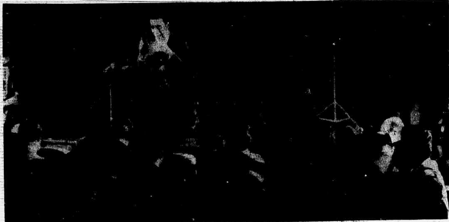
O embaixador Elbrick conta ao mundo lances do seu seqüestro

Os ministros militares que compõem a Junta Governativa editaram o Ato Institucional número 13, alterando o parágrafo 11 do artigo 150 da Constituição de 1967 e implantando no País a pena de banimento àquele que, "comprovadamente, se tornar inconveniente, nocivo ou perigoso à segurança nacional." O novo Ato Institucional não prevê prazos para a pena de banimento e está também assinado pelo ministro da Justiça. Estabelece que a aplicação da pena de banimento será feita mediante proposta dos ministros militares ou do ministro da Justiça. Os ministros Rademaker Grünwald, Lira Tavares e Márcio de Souza e Melo, e também o ministro Gama e Silva baixaram o Ato Complementar número 64, banindo do território nacional os quinze presos políticos que foram trocados pela libertação do embaixador Charles Burke Elbrick. O Ato Institucional n.º 13 e o Ato Complementar n.º 64 foram baixados pela Junta Governativa com base no Ato Institucional número 12 e se encontram datados de 5 de setembro, sexta-feira, antes, portanto, de os quinze presos terem sido transportados para o México.