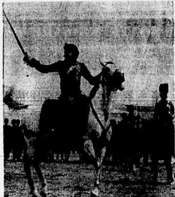
David Hemmings em A Carga da Brigada Ligeira

* Em L'Enfant Sauvage , que está sendo rodado na região montanhosa de Auvergne, o diretor François Truffaut faz também sua estréia como ator. O argumento é de linhagem muito na moda (vide