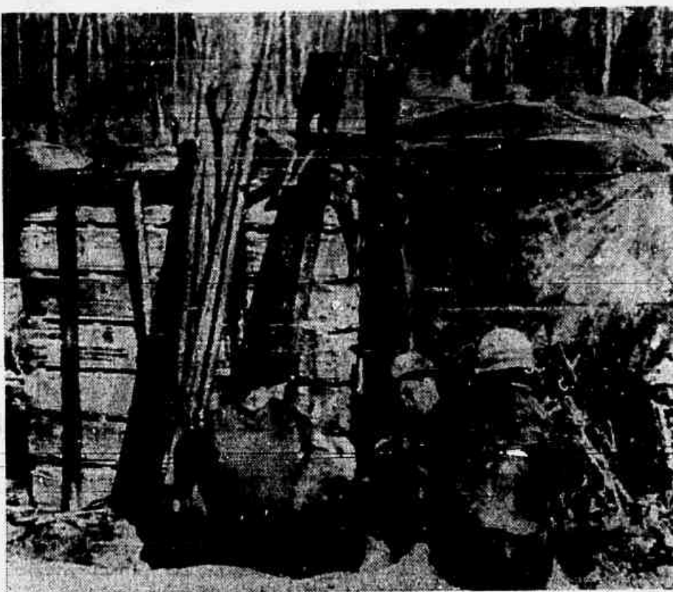
Com o cessar-fogo no Vietnam, equipe de auxílio descansa em enfermaria

Vários anos antes, Johnson estava em contato com o diplomata Vitalik Urumov da Embaixada Soviética em Paris e suas atividades foram descobertas em 1965 pela Polícia Federal norte-americana, FBI. Ele foi detido no dia 5 de abril e, segundo Spiegel, condenado a 25 anos de trabalhos forçados.