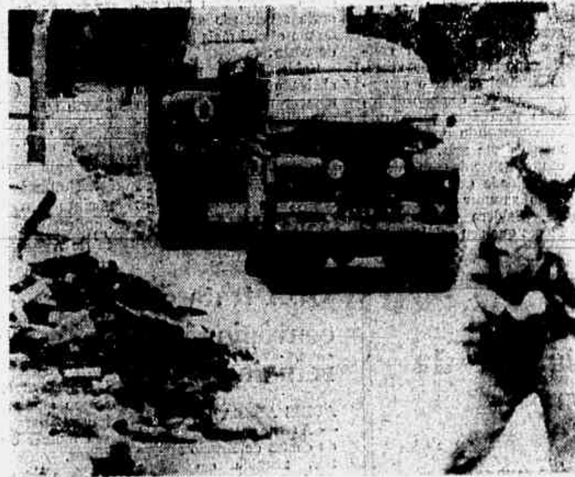
Soldados britânicos usaram gás lacrimogêneo pela primeira vez, ontem, para conter protestantes em Belfast