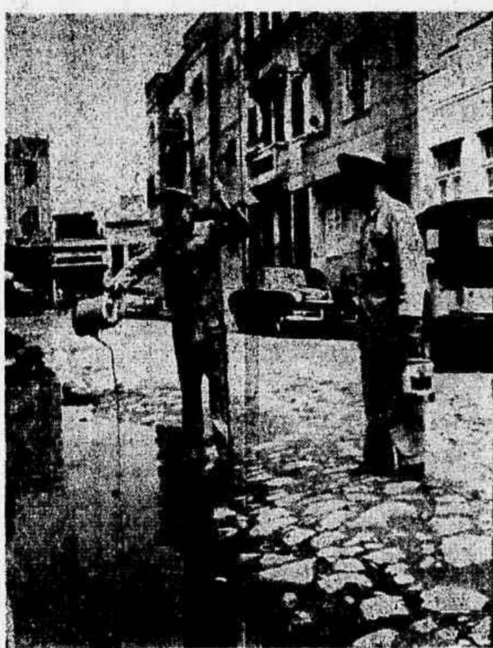
Guerra ao mosquito Saúde pública leva a pior