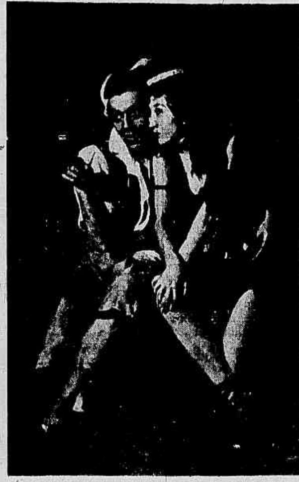
NINA VYROUBOVA e SERGE LIFAR em "FOURBERIES"

vezes as colunas da "Noite". Como aconteceu com os outros vanguardistas, Drummond al publicou prosa e verso de circunstância, procurando forçar a nota, justamente para escandalizar. Cêbre se tornou então a sua "Bucólica no caminho do Pontal" por causa de uma nota que ali aparecia no gesto de aliviar-se organicamente. Algumas revistas jogaram o excessivo pitoresco da imagem. "SERIA UMA RIMA, MAS NAO UMA SOLUÇAO" — E MORAIS publicou o primeiro livro de versos "Alguma