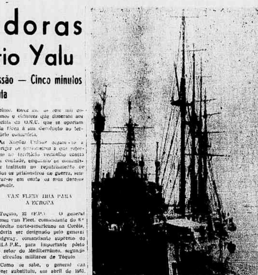
Nápoles — O "Almirante Saldanha", atracado neste porto italiano há uma hora, com o encanamento norte-americano "Albatroz" ao lado. O navio norte-americano foi enviado pelo chefe da missão militar norte-americana na Grécia, durante a guerra civil do mesmo país.

As superforças voadoras B-29, baseadas em Okinawa, voltaram a atacar as instalações hidroelétricas do rio Yalu, que os comunistas estavam tentando reparar, em resultado de arrematados ataques aliados nos meses passados. Disse a força aérea que é a primeira vez que essas aviões baseados em Okinawa atuam nas instalações elétricas comunistas. Embora os resultados desses ataques tenham sido pilotos afirmaram que sobreviveram "resultados excepcionais". Perfurantemente, caças-bombardeiros são utilizados para destruir as reparações que os bolcheviques tentam fazer nas instalações do Yalu.