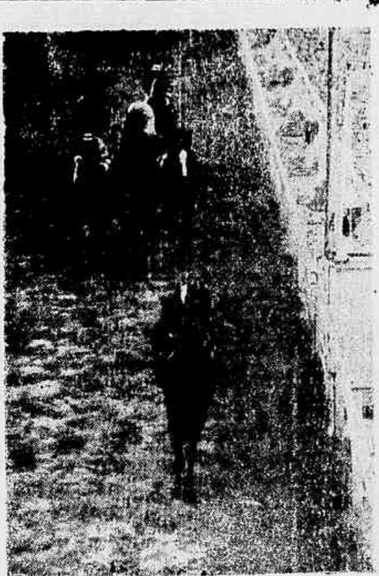
Primeira passagem: Manucho toma a pista, com Guallicho por fora em segundo, seguido de Honoro, Gatlilo, Sun Valley e Férino