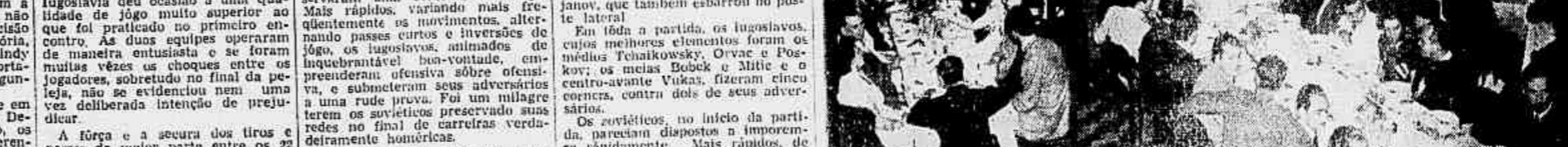
A América alçou-se as comemorações do cinquentenário do Fluminense. E na noite de ontem, promoveu um grande banquete em homenagem ao efêmero tricolor...