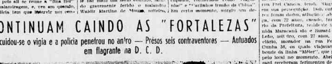
Continuam caindo as "fortalezas" — Descuidou-se o vigia e a polícia penetrou no interior — Presos seis contraventores — Afluídos em flagrante na D. C. D.

Os malandros se desentenderam e um deles atirou a desalito, ferindo o gravemente — Fugiram num auto depois de ameaçarem o motorista — Altingidos dois passageiros de um bonde que passava no local