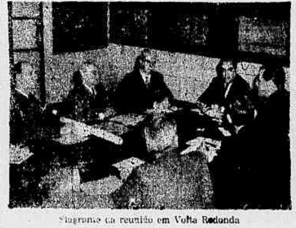
Inglaterra no reúnio em Volta Redonda

Reitera o presidente da Siderúrgica a opinião favorável que dera ao "Correio da Manhã" - Apoio do diretor da Central e interesse do ministro da Viação