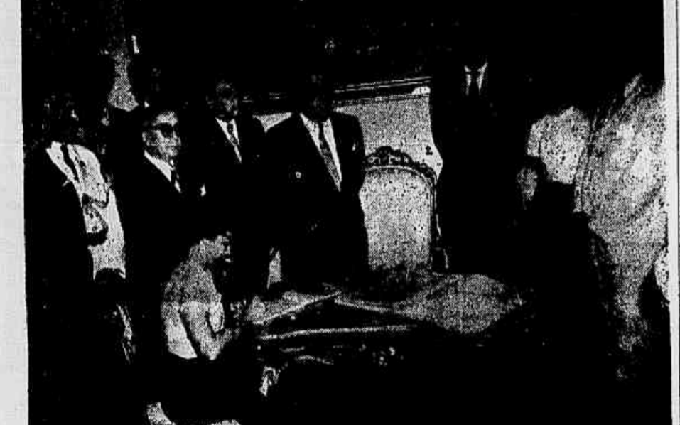
Quando falava o governador Amaral Peixoto, durante a solenidade de ontem, sobre o plano rodoviário fluminense.

As obras já encaminhadas e as contratações ontem cobrirão mil quilômetros de estradas — Revestimento de 3 milhões de metros quadrados e remoção de 10 milhões de metros cúbicos de terra — Palavras do governador Ernani do Amaral Peixoto