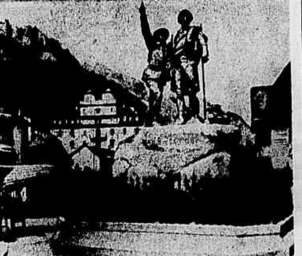
O monumento a Jacques Balmat e De Saussure, em Chamonix, alívio à escalada do Monte Branco