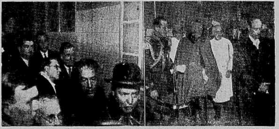
A esquerda o cardeal Cerejeira, o sr. Salazar, o ministro das Colonias e outras individualidades entrando no hospital. A direita o presidente Carmona chegando ao hospital para visitar o seu neto ferido.