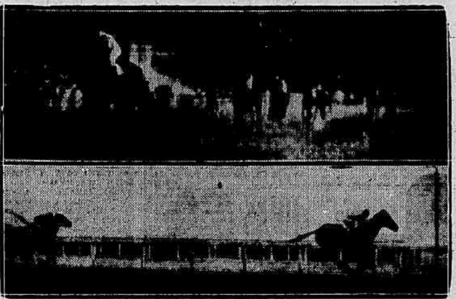
A chegada de Yambi no classico Associação Protetora do Turf, vista de frente e de lado

Yambi levantou o classico Associação Protetora do Turf, seguido, a tres corpos, por Muricy