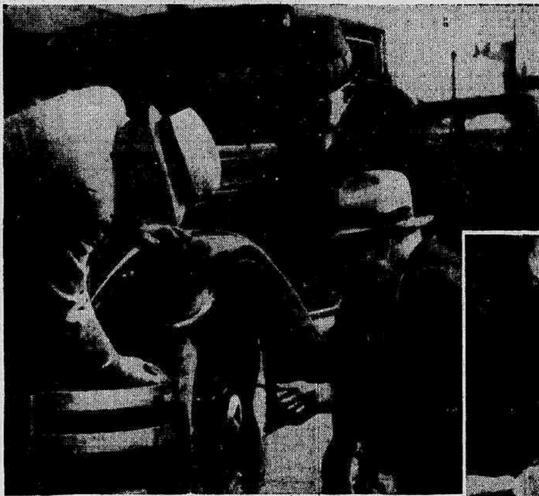
Investigadores fazendo uma das mais estranhas investigações já feitas para obter provas da maior kilometragem anti-derrapante dos pneus "G-3"

E a segurança de paradas rapidas porque o "G-3" tem mais tracção em virtude do maior numero de blocos anti-derrapantes no centro dessa afamada banda de rodagem.