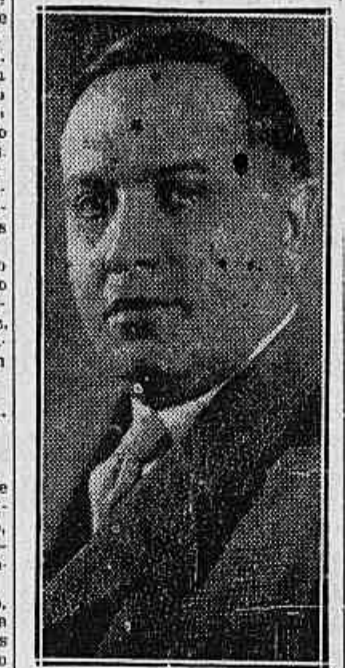
Sr. Imre Szegedi, presidente do Ferencvaros F. C.

Hungria e campeão de football da Europa Central, a qual vai jogar com o Palestra Italia, em São Paulo, no dia 30 do corrente. Embarcará depois, isto é, no dia 1 de julho, para o Rio e, no dia 4 ás 6 horas da noite, no "estadium" do Fluminense, enfrentarão o scratch Rio de Janeiro e na tarde de 7, jogará no mesmo "estadium", de scratch, o B. B. B. Voltará á S. Paulo, onde disputará um match com o scratch S. Paulo, isso no dia 14, e á 18, embarcará para Montevideo, onde jogará com o team uruguayo. A equipe do Ferencvaros F. C. está constituída de seguintes jogadores: Ignace, Anselm e Szaboalkai, keepers; Takacs, I. Hungler e Pap, backs; Fulkman, Bu Kovy, Obiz, Berkesi e Liza, halves e Kohut, Toth, Szecskel, Turay, Tibacs II, Raso, Kovacs e Tanczer, forwards. Acompanham-nos nessa excursão festivamente recebidos por uma comissão de recepção, da qual faziam parte pessoas de relevo na esphera húngara e dura-se a permanencia do "Giulio Cesare" no porto, realizaram, de automatico, de accordo com o que organizou a S. A. V. I., passeios aos pontos mais importantes da nossa capital.