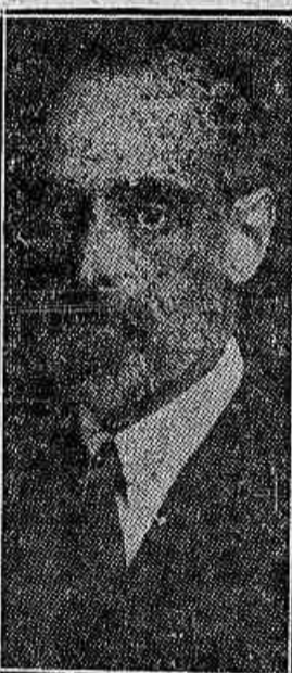
O ex-ministro Francisco Cambó

Uma personalidade de grande indistinctivel relevo da Hespanha não má, num cumprimento de um dos maiores nomes da politica hespanhola, viaja no luxuoso transatlantico. Trata-se de Francisco Cambó, ex-ministro das Finanças da Hespanha e o foi também das Obras Publicas e que, antes do advento do novo regimen governamental no seu país, teve na politica hespanhola uma actualiação de invulgar merecimento á um prestigio inconfundivel. Francisco Cambó, mudada a feição politica da Hespanha com a dicitadura de Primo de Rivera e não se conformando com o novo estado de coisas, nem querendo por-se ao lado do dicitador, retrahiu-se e por completo afastou-se da politica, não deixando, porém, o proprio país, como o fizeram outros hespanhoes illustres, hoje no estrangeiro e alguns dos quaes impedidos de regressarem á Hespanha. Cambó preferiu ali permanecer e dedicou-se exclusivamente á organização de importante empresa industrial, que progrediu e se ramificou á America do Sul — a Companhia Hispano-Sul-Americana de Electricidade. Francisco Cambó, o ex-ministro das Finanças da Hespanha, occupa um dos appartamentos de luxo do "Giulio Cesare". Nelle se conservam — segundo nos informaram a bordo — quasi que durante toda a viagem e por rarissimas vezes foi visto