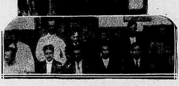
O primeiro bonde da Light que hontem trafegou, guarnecido por soldados, abaixo, varios detidos pela policia