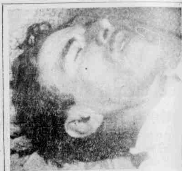
O marceneiro suicida