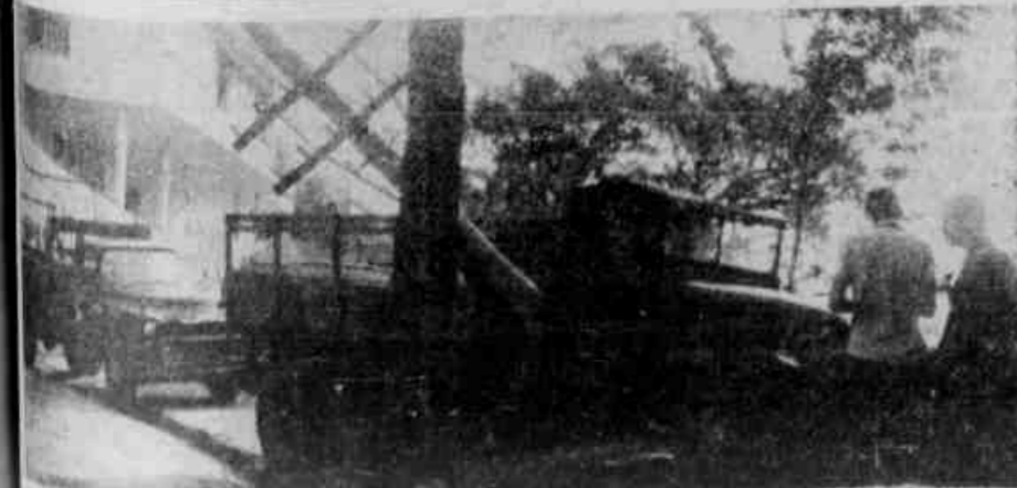
O caminhão acidentado

PREÇO DO EXEMPLAR Cr$ 3,00 EM BRASÍLIA Cr$ 5,00 8 PAGINAS