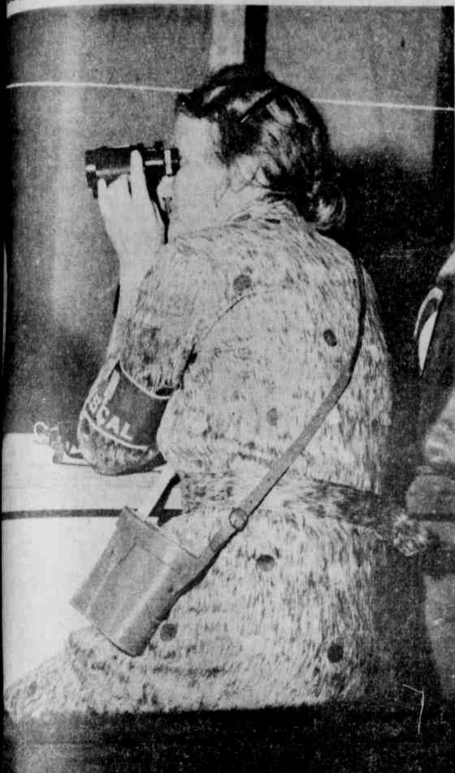
Fiscalizando a apuração por um binóculo

ACENTUA-SE A FRAUDE NA APURAÇÃO DO MARACANÃ — URNA COM VOTOS QUE NÃO FORAM RUBRICADOS — POSSIBILIDADES DE ELEIÇÕES SUPLEMENTARES