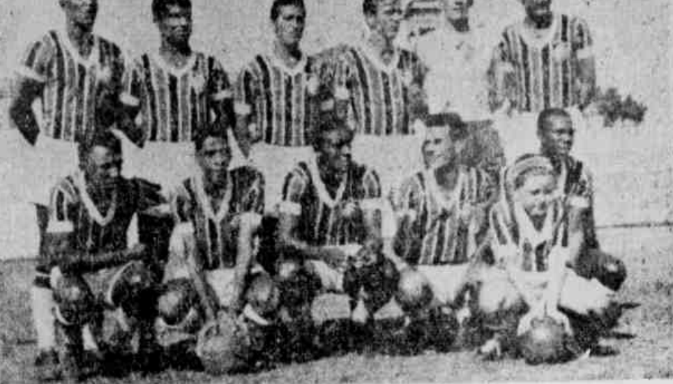
O quadro do líder enfrenta hoje o Bangu e embarca amanhã para o Sul do País

Para o clássico inaugural do retorno, entra as equipes do Fluminense e do Bangu, que terá como palco o Estádio do Vasco da Gama, em substituição ao Maracanã (que está entregue ao Superior Tribunal Eleitoral), estarão em ação os seguintes atletas: