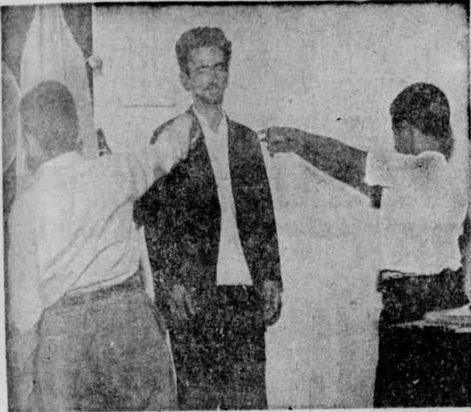
Na delegacia o corruptor de menores é apontado por suas vítimas

APÓS AFASTAR SUAS VÍTIMAS DA CASA DOS PAIS, SEVICIAVA-AS E AS OBRIGAVA A FURTAR