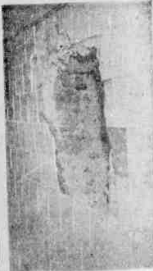
O buraco na parede

A casa comercial — Rei da Voz — sucursal da Rua Riachuelo, 337 e 339, na madrugada de ontem, foi assaltada por marginais. Os ladrões penetraram no seu interior, através de uma janela do 1.º andar, guarnecida por uma grade de ferro. Arrombaram-na. Do recinto do estabelecimento subtrairam peças de rádios, ge-