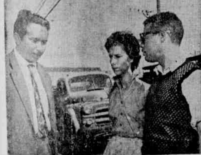
A casa invadida e o jornalista e a esposa falando ao repórter