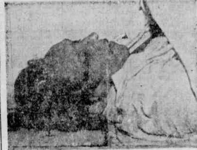
Clientes do curandeiro