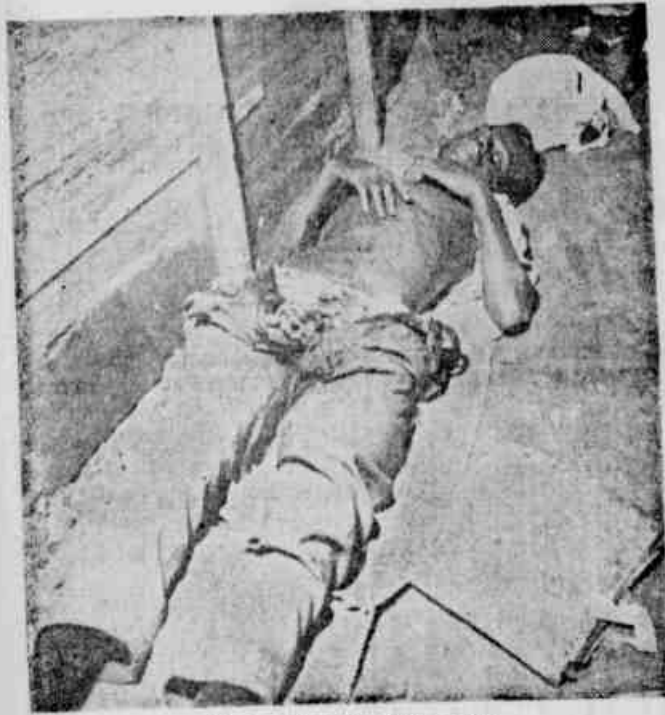
O operário assassinado a faca

APÓS OS CRIMES, RECOLHEU-SE CALMAMENTE À RESIDÊNCIA — AO SER PRÊSO, NEGOU OS DELITOS