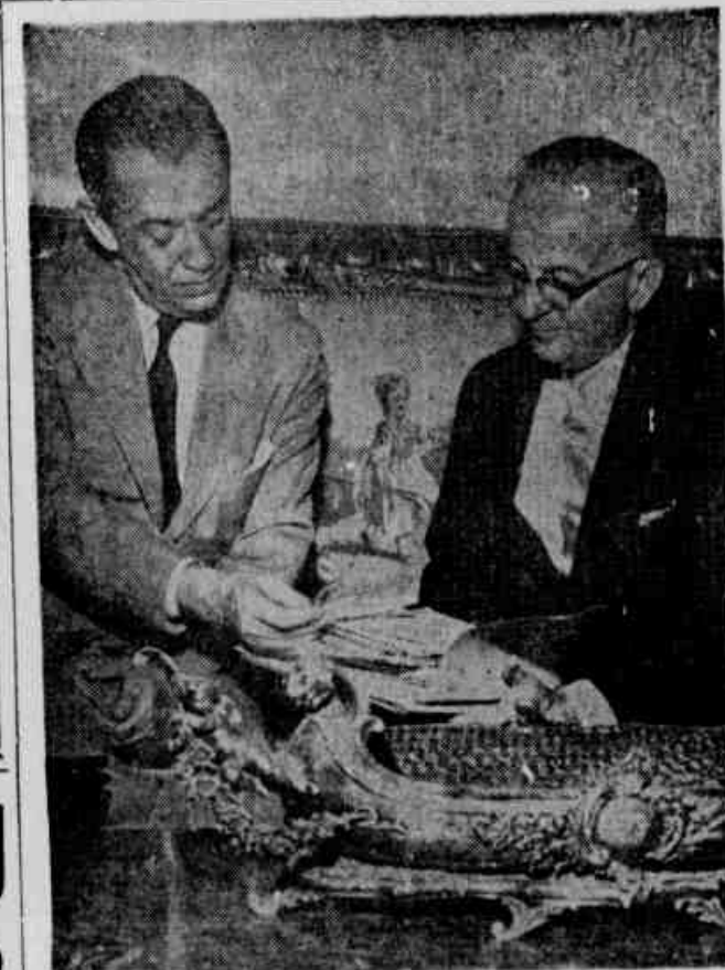
NAS LARANJEIRAS O GOVERNADOR DA BAHIA — O presidente Juscelino Kubitschek recebeu, na manhã de ontem, em audiência especial no Palácio das Laranjeiras, o sr. Juraci Magalhães, governador da Bahia, que tratou, com o chefe do Governo, de assuntos administrativos daquele Estado. Na foto, um flagrante de visita.