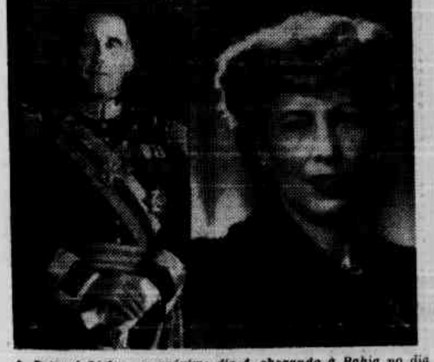
Deixará Lisboa no próximo dia 4, chegando à Bahia no dia seguinte, o "Super-Constellation" que trará ao Brasil o Chefe de Estado português. No "clique", o presidente Craveiro Lopes e sua esposa.

LISBOA, 31 (F.P.) — Os jogadores de futebol do clube Benfica, selecionados para os dois encontros entre Portugal e Brasil, a serem realizados durante a visita do presidente Craveiro Lopes, só poderão to- (Conclui na 2.ª página)