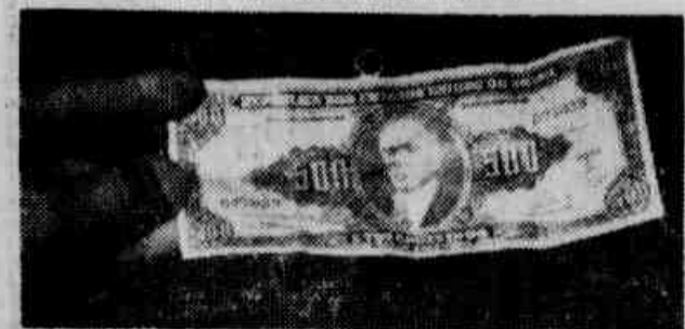
A cédula de 10 cruzeiros virou nota de 500