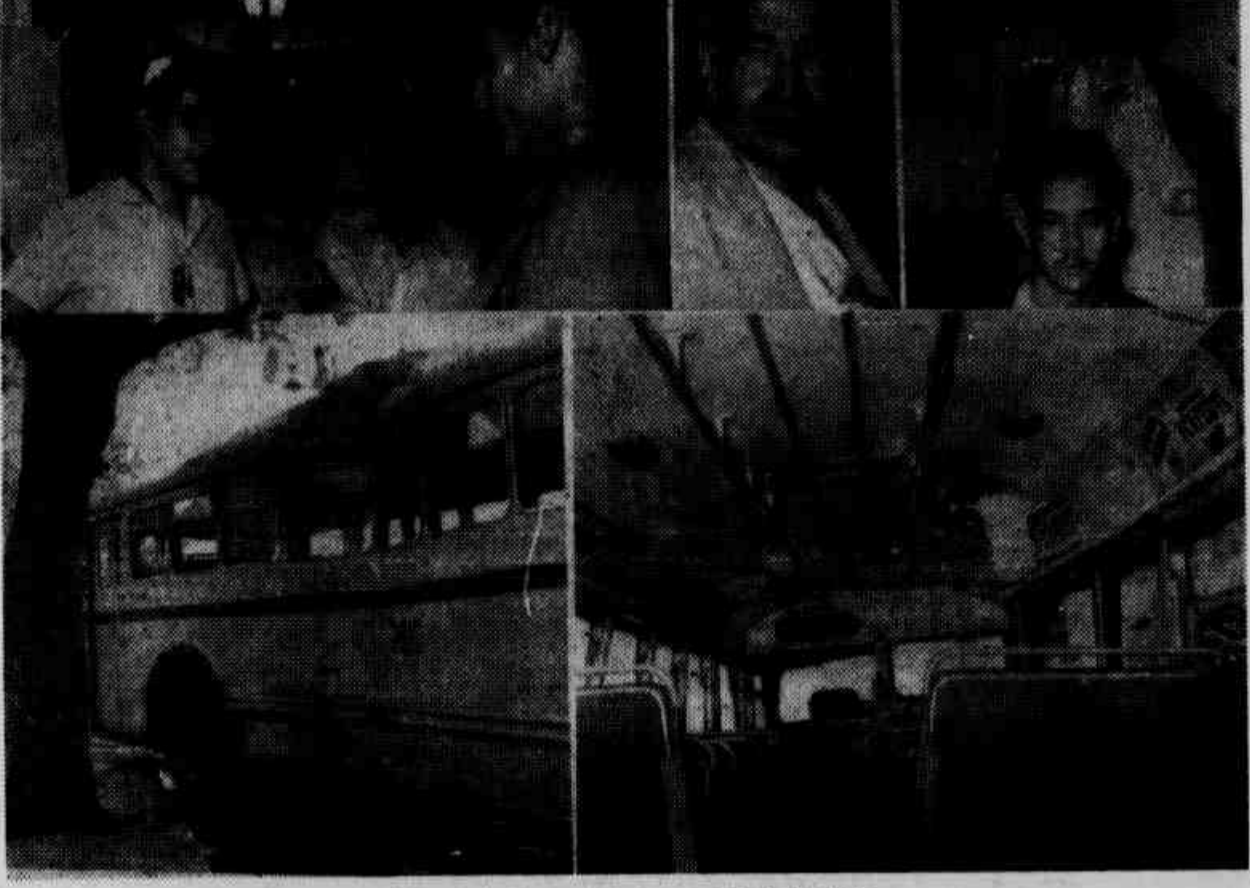
Pessoas feridas no desastre e o ônibus sinistrado.

Vinte e Quatro Feridos no Desastre de Ontem, na Praia do Russell