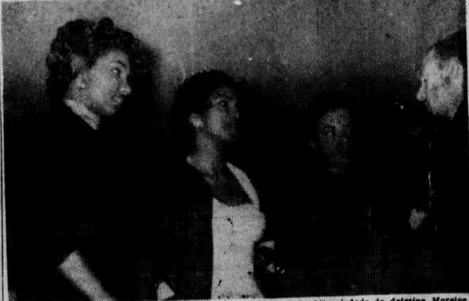
As "girls" da "boite" "Night and Day", quando narraram a arbitrariedade do detetive Moreira.

Lavadas Para a Delegacia de Costumes, as Três Artistas — Afinal, Postas em Liberdade Pelo Comissário